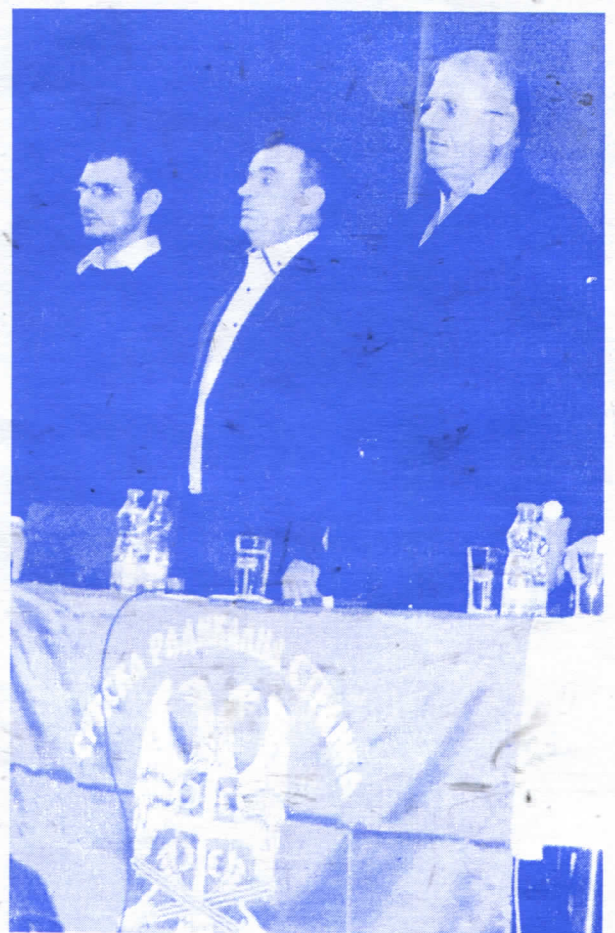
др Војислав Шешељ на трибини у Бачу