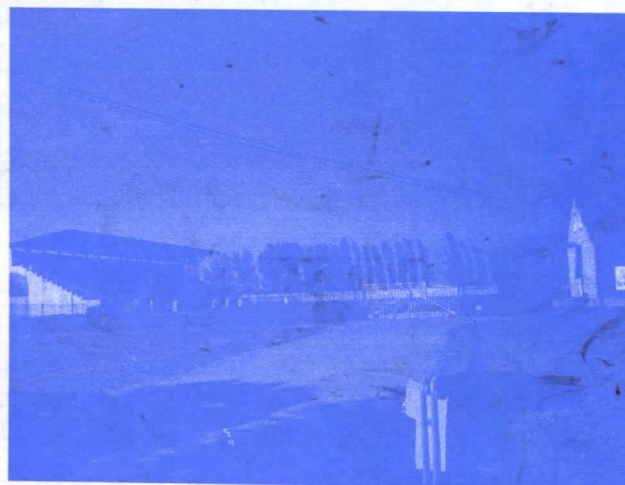
ПОМОЋ ЧСК-у У ПРАВИ ЧАС