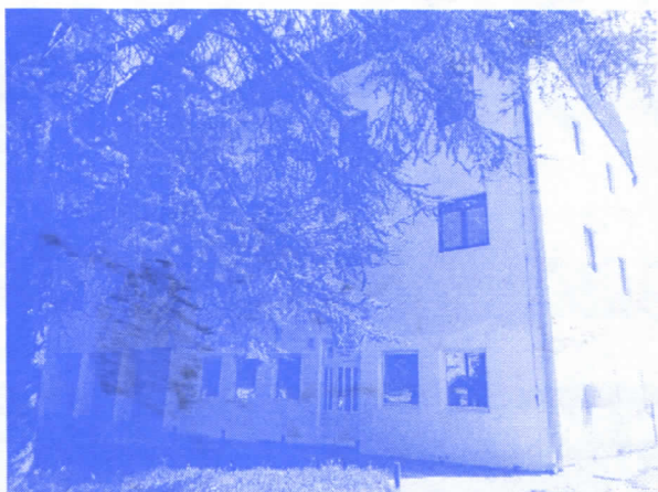
ТРИ МИЛИОНА ЗА ДОМ КУЛТУРЕ