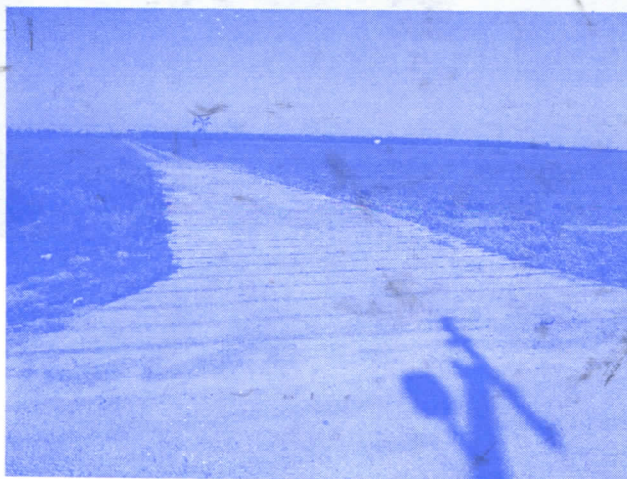
ОТРЕСИШТА И АТАРСКУ ПУТЕВИ