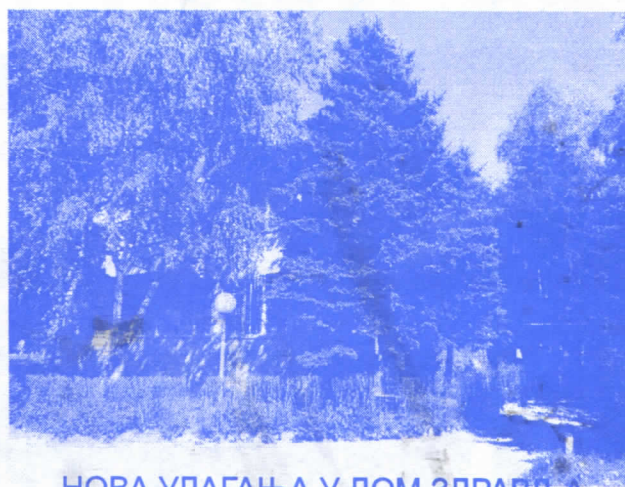
НОВА УЛАГАЊА У ДОМ ЗДРАВЉА