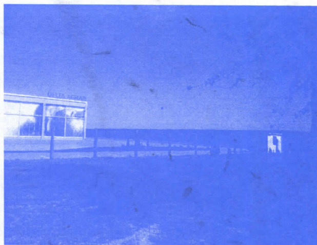
ДОЗВОЛЕ У РЕКОРДНОМ РОКУ