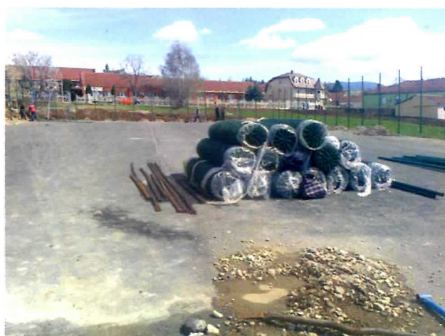
У ТОКУ ЈЕ ИЗГРАДЊА ТЕРЕНА ЗА МАЛЕ СПОРТОВЕ У МИКРО НАСЕЉУ (НАЗВАНО "РАДИКАЛСКИМ" ИГРАЛИШТЕМ)