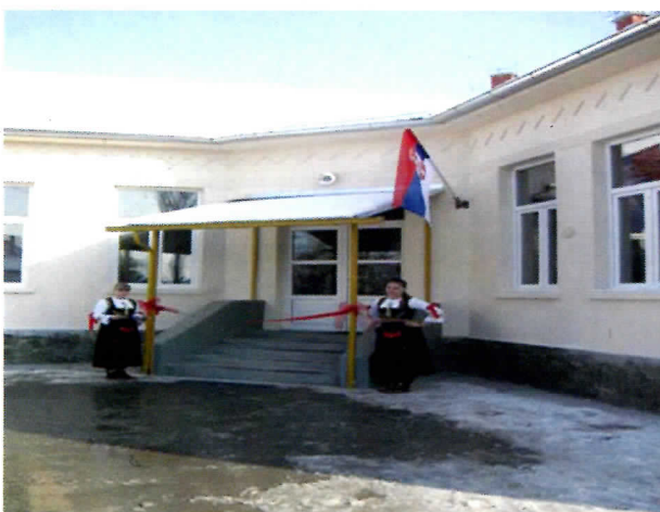
РЕКОНСТРУИСАНА ШКОЛА У БОБОВИШТУ, ТАКОЂЕ, ИЗГРАЂЕНА ШКОЛА У ДРАЖЕВЦУ