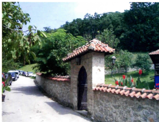
ЗАВРШЕН ПУТ КАТУН-ЛИПОВАЦ, ЗАХВАЉУЈУЋИ ПАТРИЈАРХУ