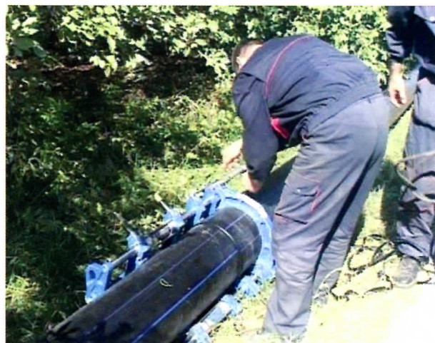
ИЗГРАДЊА ВОДОВОДА НА ТЕРИТОРИЈИ ОПШТИНЕ