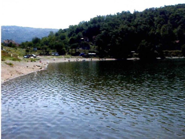
СТАЛНА УЛАГАЊА У УРЕЂИВАЊЕ ПРОСТОРА НА БОВАНСКОМ ЈЕЗЕРУ