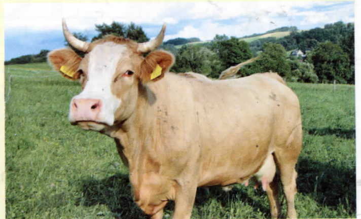
До сада сам давала 20 литара млека дневно, а председник Тадић је обећао бирачима да ћу после избора давати 30. Не знам како, жива нисам!

Заједно са Млађаном Динкићем и Г 17, уништили су и оно последње што је људима остало – наду да ће сутра можда бити боље.