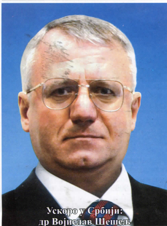
Ускоро у Србији: др Војислав Шешељ