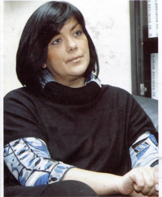
ЈАДРАНКА ШЕШЕЉ кандидат за председника Србије