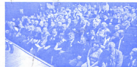
“Полицијски досије” напунио салу