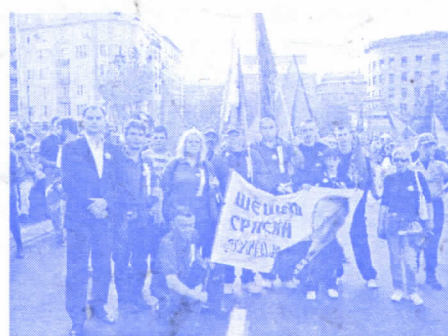
Параћински радикали дали су подршку српском хероју Младићу

Чланови СРС из Параћина ишли су у Београд (Центар Сава) на научни скуп о Војиславу Шешељу и на митинг поводом злочиначког хапшења генерала Младића.