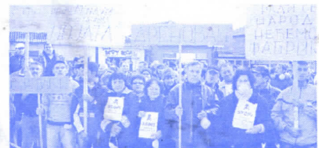
Српски радикали су први подигли глас против изградње опасног постројења и истрајали до победе

Чланови Општинског одбора СРС су учествовали на демонстрацијама у Ћићевцу и Дреновцу против изградње Постројења за физичко-хемијски третман опасног отпада у непосредној близини Параћина.