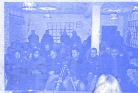
Трибина у Шавцу