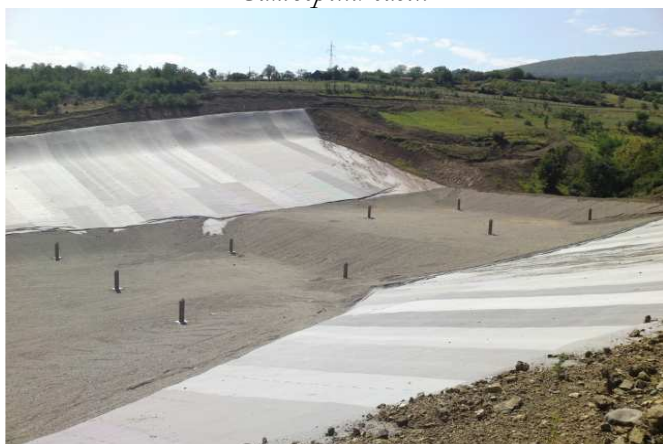
Нова регионална санитарна депонија

Општински Одбор Демократске странке у Пироту је био против изградње затвореног базена, и директно се сврстао у противнике развоја спорта у Пироту!