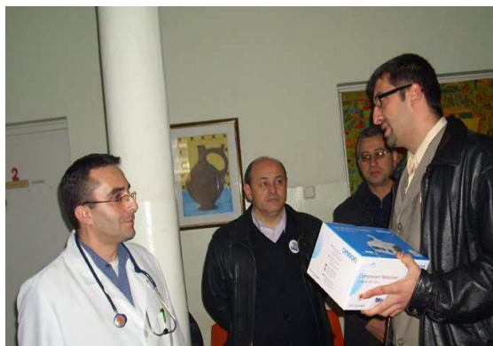
Донација Дечијем диспанзеру - инхалатори

Српска радикална странка је својим радом издејствовала повећање буџета: за пољопривреду, социјална давања као и бесплатне аутобуске карте за особе старије од 65 година, за рад амбуланти у селима, радило се и на иницијативи за добијање статуса града, развијању туризма, сточарства и ратарства као и за пројекте који ће допринети ревитализацији скоро напуштених села на обронцима Старе Планине и омогућити искоришћавање природних богатстава која нуди ова планина: квалитетна вода, папшњаци, букова и јелова грађа, лековито биље, мермер, разноврсни биљни и животињски свет и др.