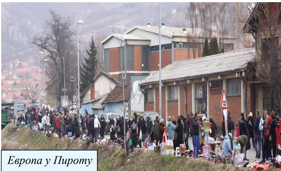
Европа у Пироту

Пироћац (по дедине линије) Божидар Ђелић и ДС обећавали су нам улазак у ЕУ 2004, 2007, 2008, 2011. и брзо заборавили шта су нас лагали, а сада кажу улазак 2019. а за сада само статус кандидата, а оно - нема ни статуса. Сада смо постали само кандидат за кандидата. Прст на чело и размислите да ли Вам је важнија Србија од шарене лаже! За Српску радикалну странку СРБИЈА НЕМА АТЕРНАТИВУ!