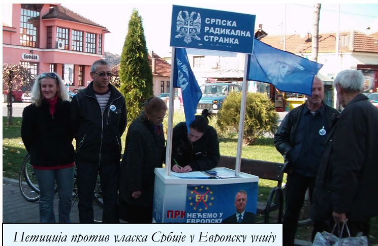
Петиција против уласка Србије у Европску унију

политике коју воде прозападне странке на челу са ДС-ом и СНС-ом чија се политика своди на Европа нема алтернативу као и прича „И Косово и ЕУ“, сада се види да је то лаж и превара грађана Србије!