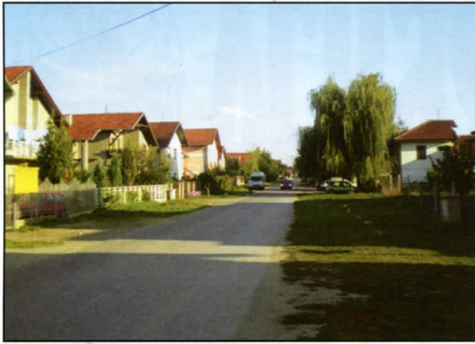
Улица Стевана Синђелића изграђена за време радикалске власти