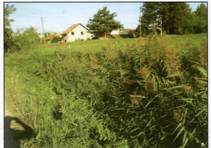
Запуштени канали атмосферске канализације