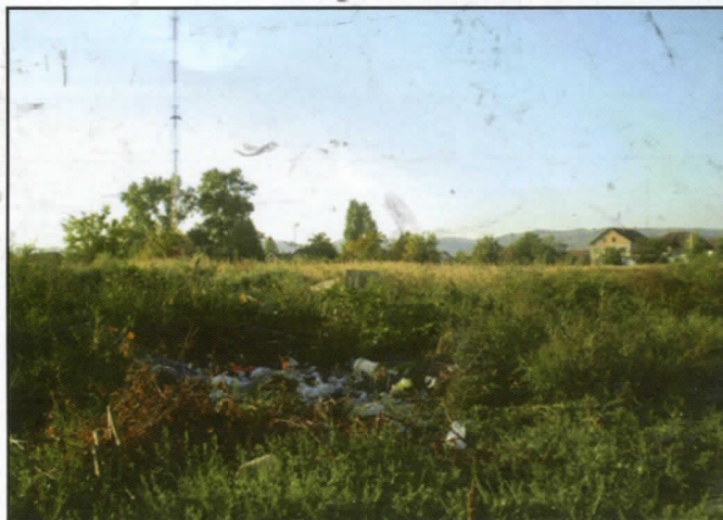
Дивље депоније и амброзија

- спречили смо постављање базне станице мобилне телефоније у центру Адица