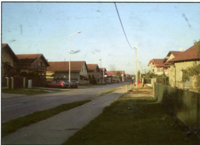
1400 метара улице Бранка Ђопића изграђено за време власти Српске радикалне странке

Само на Адицама у мандату 2004-2008, када је СРС била на челу градске власти урађена је: