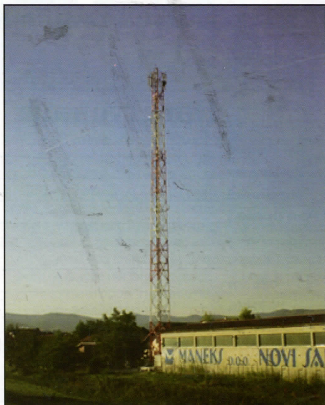
Незаконито постављена антена мобилне телефоније

2. Да се састави петиција која ће бити упућена градским челницима