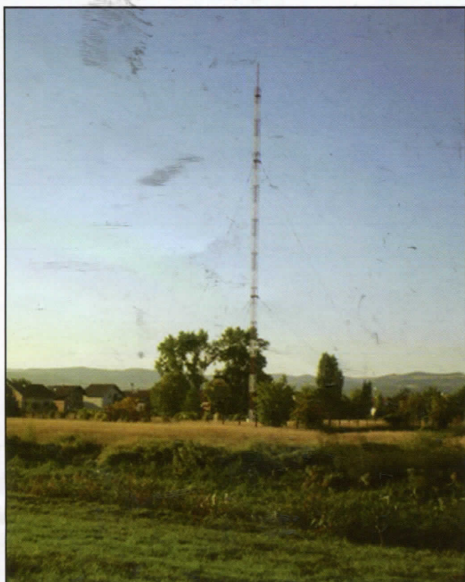
Спорна антена РТВ Војводине