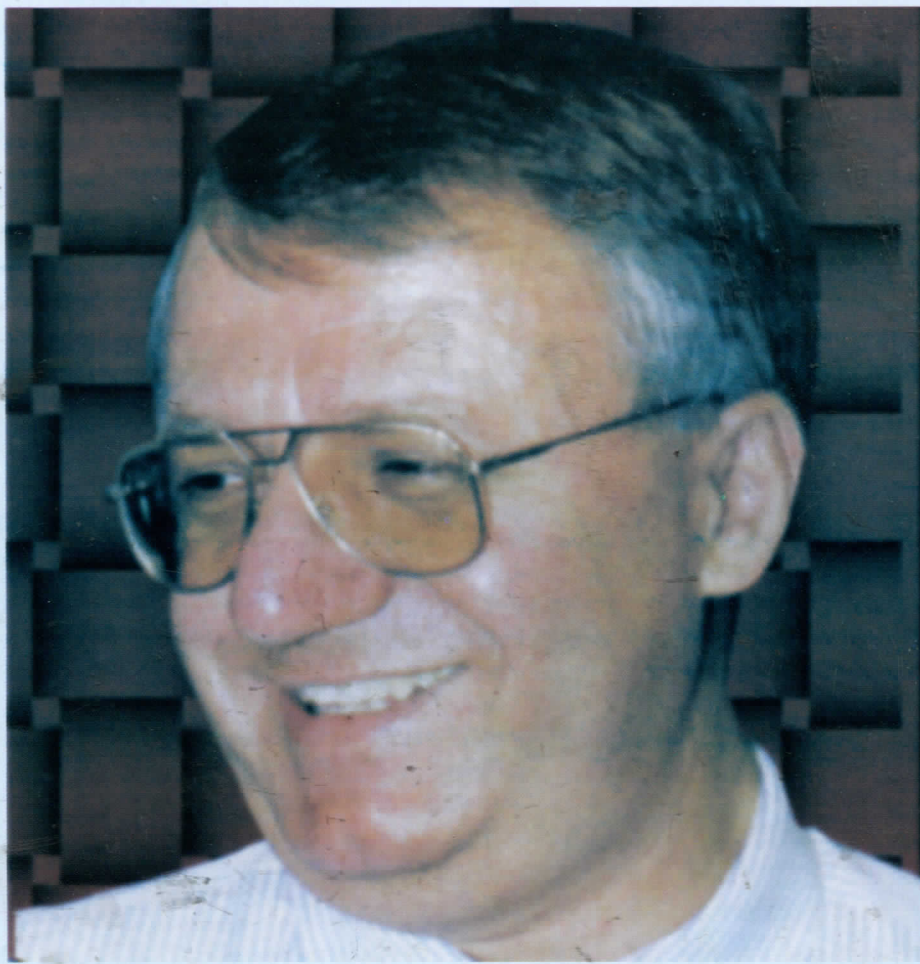
Проф. Др Војислав Шешељ

БЕЛА ПАЛАНКА, АПРИЛ 2009. ГОДИНА XX БРОЈ 3305