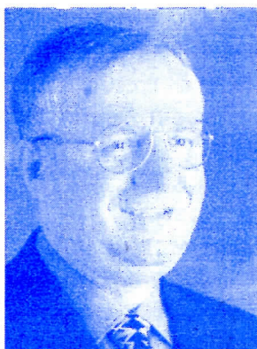
Др. Војислав Шешел Победићу Хашки трибунал

СТАРА ПАЗОВА, МАЈ 2009 ГОДИНЕ ГОДИНА XX БРОЈ : 3297