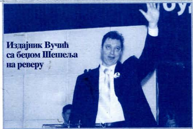
Издајник Вучић са беџом Шешеља на реверу

Потребно је било усвојити Статут општине Ковин у року, а они су недоласком на седнице сасекли грану на којој седе, а потом бацили кривицу на нас служећи се лажима.