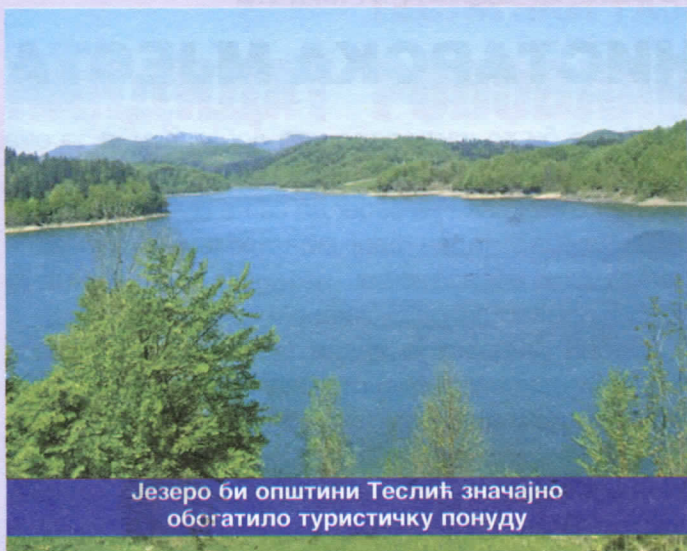
Језеро би општини Теслић значајно обогатило туристичку понуду

кроз Републику Српску. Крајње је вријеме да ми у Теслићу почнемо са припремама за прикључење главном плинководу и да кренемо са пројектима израде локалне плинске мреже. Довођење плина у свако домаћинство најјефтинији је вид довода и кориштења енергије чиме се све дилеме око топлификације Теслића рјешавају.