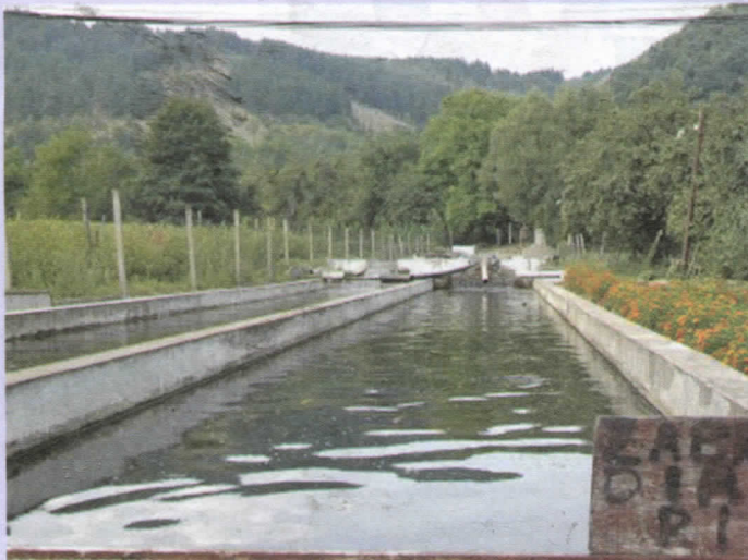
Општина Теслић има изузетне услове за развој рибарства

Пожурићемо са изградњом хладњаче од 1000 т, а пласман производа ишао би уз помоћ општине.