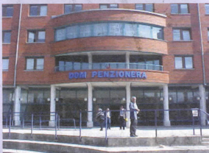
Радикали ће овакав Дом пензионера изградити у Теслићу

Теслићу је потребан Дом за стара и изнемогла лица и ми ћемо покренути иницијативу за изградњу Дома. Имали смо одређене контакте са могућим суинвеститорима и вјерујемо да поред општине Теслић постоје и други вољни да суфинансирају изградњу Дома.