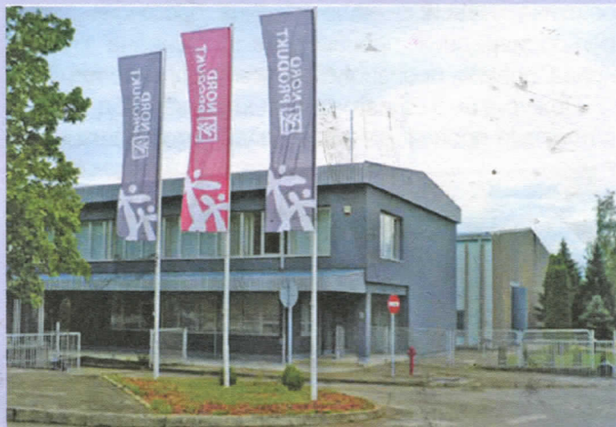
Оваквих производних погона биће ускоро широм општине Теслић

Свима који буду жељели да инвестирају на подручју општине Теслић у функцији запошљавања