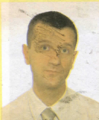
Под његовом командом радници од посла падају у несвијест