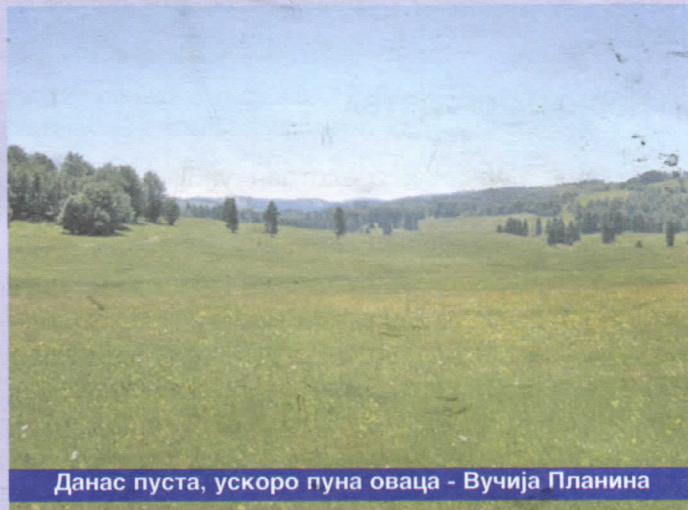
Данас пуста, ускоро пуна оваца - Вучија Планина

Теслић има низ локалитета гдје се могу изградити мања акумулациона језера, која би поред енергетског имала и туристички потенцијал. Давањем концесије за изградњу водоакумулације и мање хидроцентрале, општини би без било каквих улагања, створили претпоставке за туристичке активности на језеру и око језера, зашто постоји велики интерес.