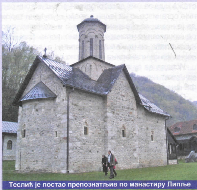
Теслић је постао препознатљив по манастиру Липље

Техничке могућности дозвољавају да се телефонским каблом у сваки дом на општини може довести кабловска телевизија. Кренућемо у активности и разговоре са "Телекомом" и кабловским дистрибутером и вјерујемо да ћемо у веома кратком року у сваки дом довести кабловску телевизију са тридесетак ТВ канала.