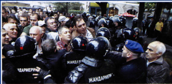
Протести против хапшења

Захваљујући тако неодговорној одлуци Општина Раковица и даље неће водити бригу о социјално угроженима, неће бити никог у власти да се бори за пензионере, наставиће се продаја раковичке индустрије и уследиће нови талас отпуштања из наших фабрика... Да ли су им бирачи за то дали мандат?