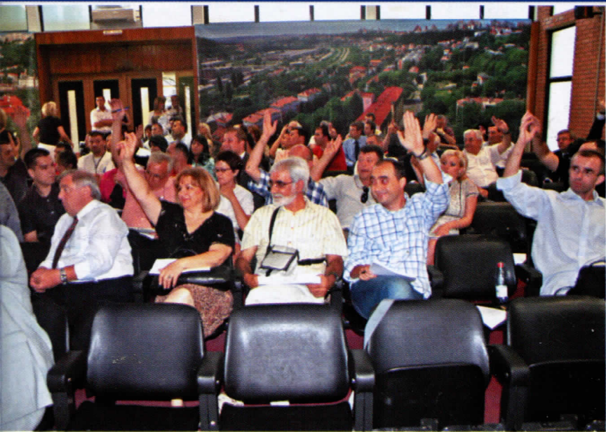
СПС, ДС, ЛДП, Г17 - заједно за пропаст Раковице

фраструктура. Поједина насеља немају ни воду, ни струју, ни канализацију, а о белгје Раковице, где грађевинска мафија све више атакује бесправном градњом, спортска игралишта. Легализација целих стамбених насеља није ни започела, иако оловани су само они објекти чији власници су блиски власти или су били у ине.