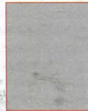
5. Свјетлана Радовановић, рођена 1982.године, студент.