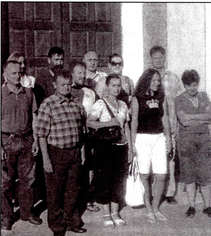
Један дио одборника Савеза српских странака Сребренице