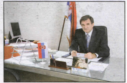
Председник скујшћине ојшћине Зоран Сјокућа

У садашњим условима више-партијског система, функционисања Скупштине на бази скупштинске већине, коалиционог партнерства и различитих политичких ставова и мишљења било је и доста неуспешности. Треба истаћи да одборници опозиције, вољом њихових партија и сопственим опредељењем, нису желели да учествују у раду