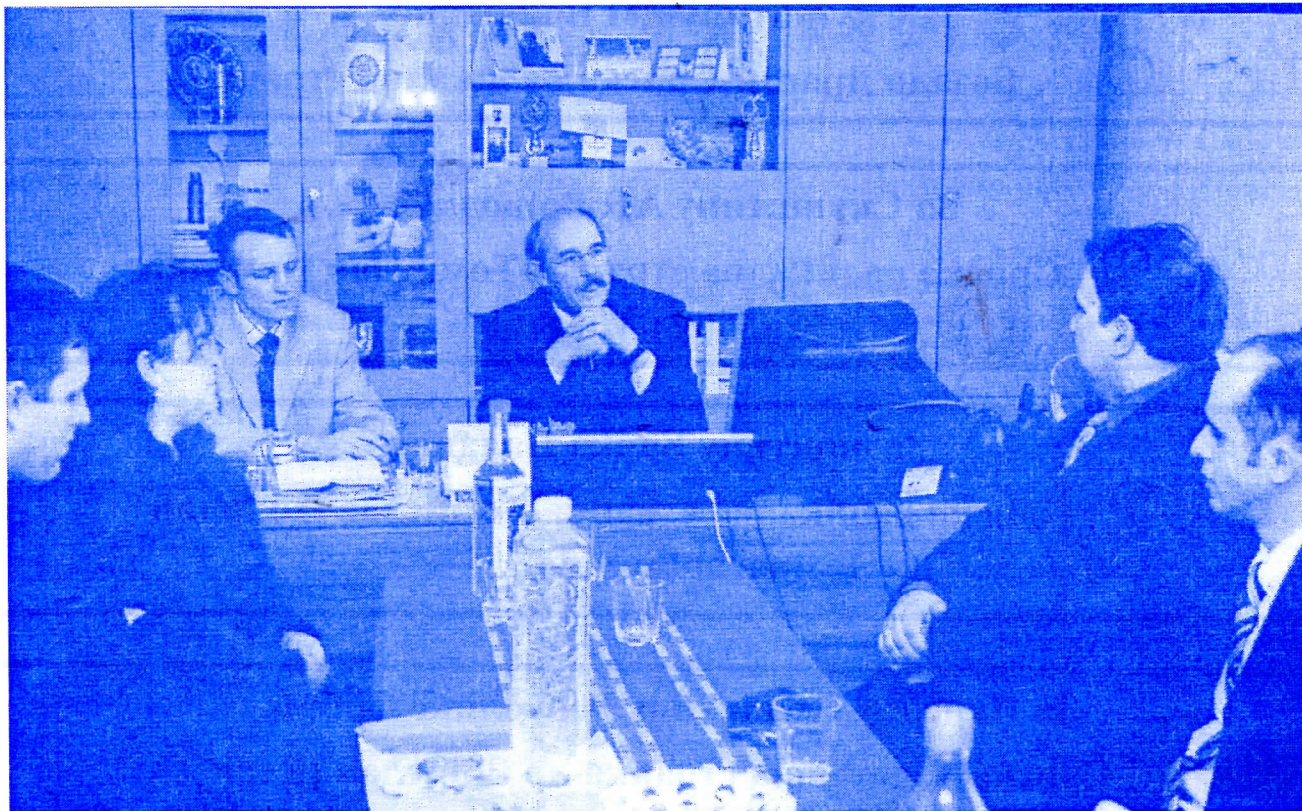
Амбасадор републике Словачке у Пивницама са представницима општине Месне заједнице школе и цркве