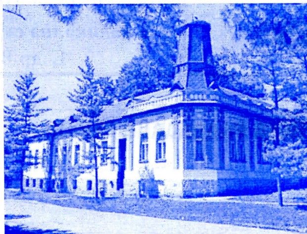
створићемо стабилну Месну управу