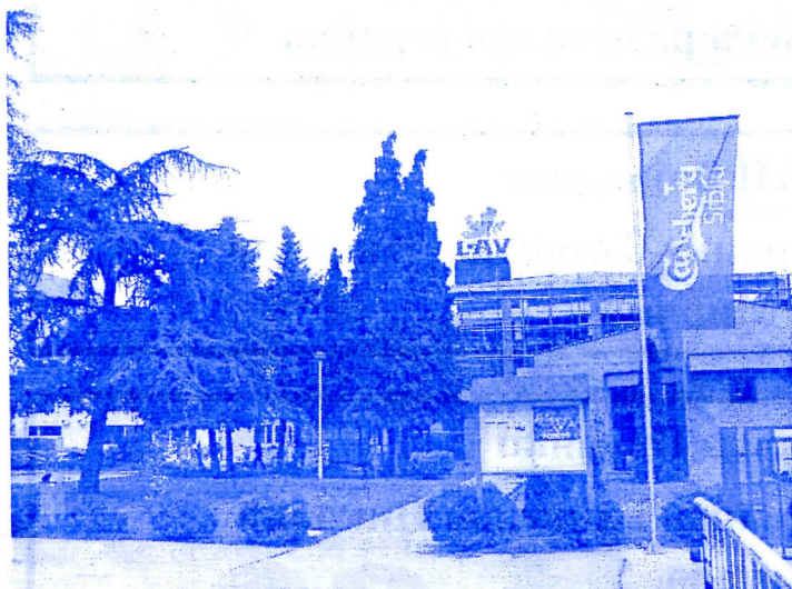
документација за проширење пиваре у рекордном року