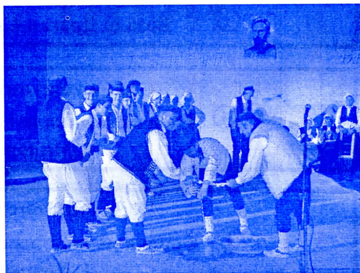
помоћ манифестацији Кочићеви дани