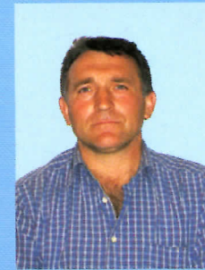
Новак Милутиновић возач