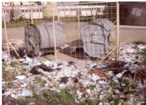
Делонија смећа код Машинског факултета

Град нам није чист, а да ли је чиста савест досадашњој градској власти, то нека наши суграђани сами закључе.