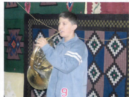
Фотографије са културнозабавних и спортских манифестација