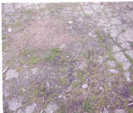
детаља са "Новог" асфалта у с. Чамурлија

нажалост, помогао да "купи" одборнике у Скупштини Града Ниша и да преко њих уз коалицији са "жутима" ради шта хоће. Ипак, по оној народној "У лажи су кратке ноге", гласачи су увидели целу истину и обману. Градска општина Црвени Крст је преко свог информатора на НТВ петком у 18,30 часова и суботом у 14,30 часова објашњавала грађанима да не гради дирекција него да се то гади према Програму изградње ГОЦК из средстава буџета Града Ниша где су наменски издвојена средства за изградњу инфраструктуре Градских општина.