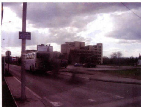
Пример „исправног аутобуса“

Како је сада већ бивша власт у Нишу организовала градски превоз најбоље говоре речи наших суграђана који уопште нису задовољни са превозом. Основне замерке Управи за саобраћај су: