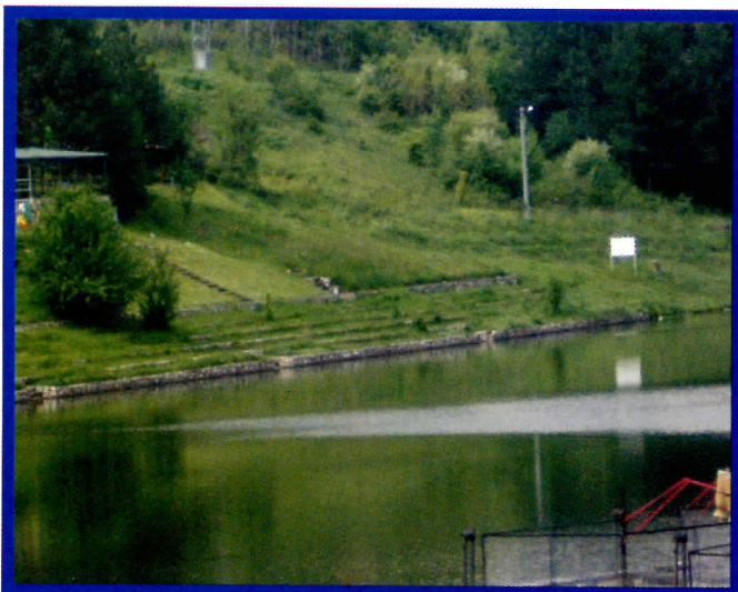
Досадашња власт се здушно потрудила да улаже у туризам

Оплеменићемо језерски и бањски туризам који има завидну традицију. Отворићемо могућност приватне иницијативе и улагања домаћих и страних инвеститора у ову област. Јавним конкурсима, без провизија и "веза" доведићемо инвеститоре и туристе и тако подићи стандард суграђана.