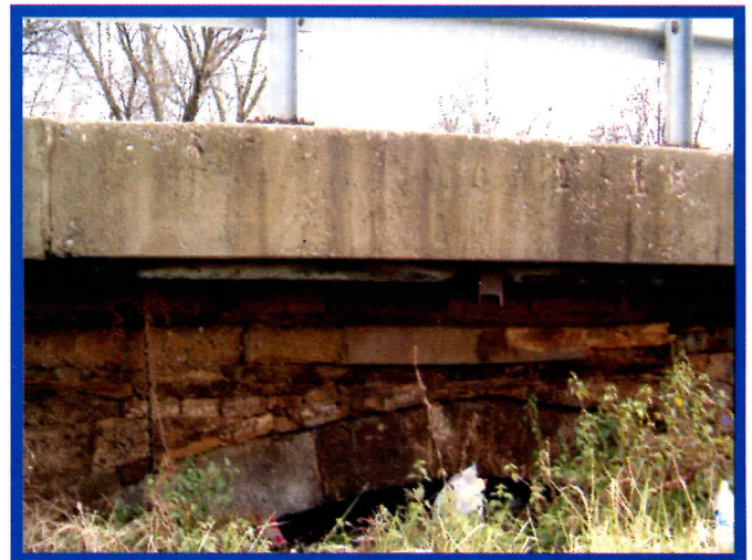
Историјски сјоменик - дејонија

У седишту општине сачуваћемо постојеће и где год је то могуће формирати нове парковске површине.