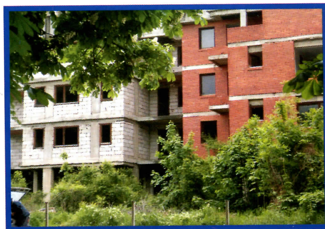
Чека стјанаре, а не зна се власник...

Ми градимо, а не рушимо, гесло је којег ћемо се придржавати у поступку легализације објектата који су изграђени без грађевинске до-