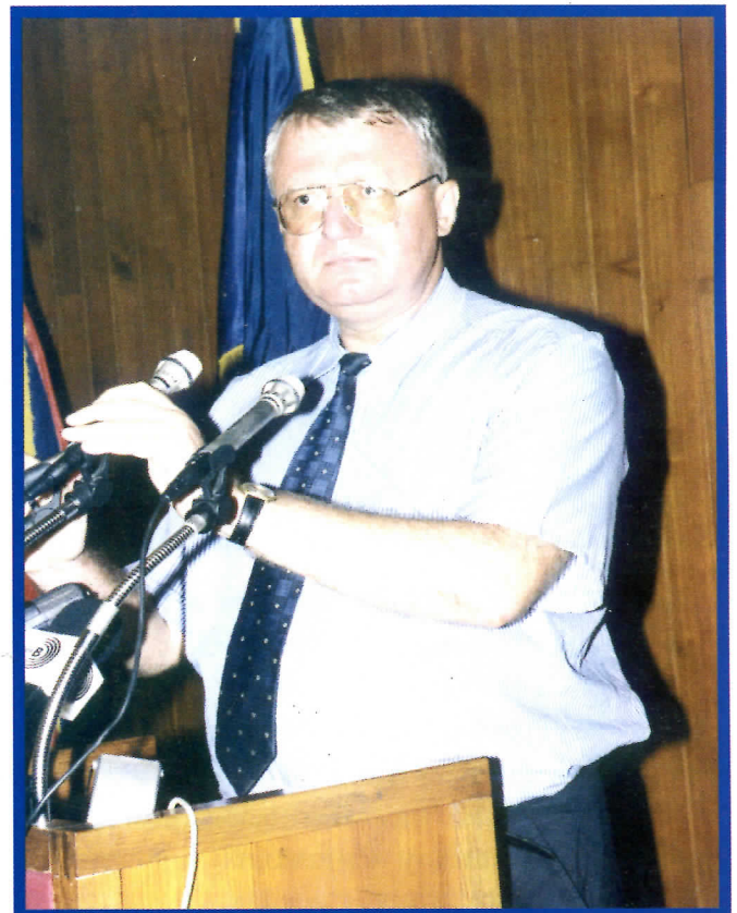
Проверени модел функционисања локалне самоуправе успоставио је проф. др Војислав Шешељ

самоуправе је модел који је наш председник проф. др Војислав Шешељ успоставио у Земуну у време када је, на добробит свих грађана, обављао функцију председника Општине. Уверени да је то и ваш модел, надамо се да ћете нам својим гласом омогућити да га применимо и у вашој општини.