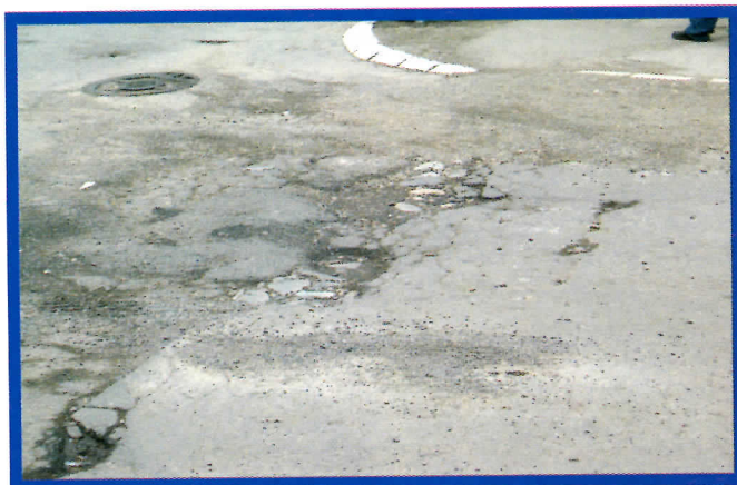
Раскрсница после интервенције екипе из ЈКП "Водовод"

Знамо какве имате проблеме са лошом или непостојећом комуналном инфраструктуром. Локална власт Српских радикала обезбедиће средства и изградити примарну комуналну инфраструктуру у сваком делу општине где она сада не постоји.