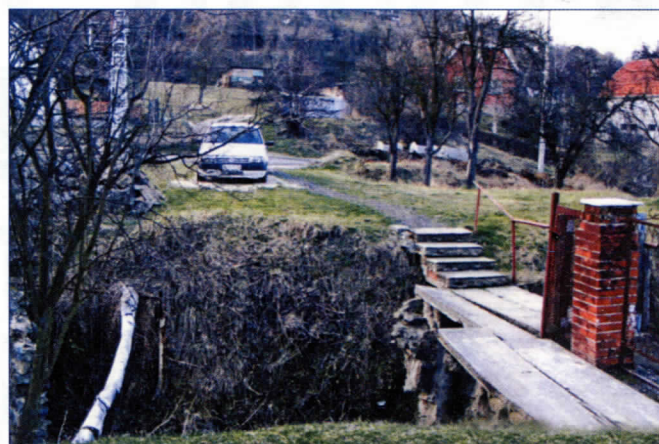
Мост уништен у поплави није обновљен

постоји опасност од пада у поток дубине преко 4 метра. Кијевчани траже да се на истом месту изгради нови мост. Неопходно је, како су нам рекли, и асфалтирање једног дела Летићеве улице у дужини од око стотинак метара, где се после сваке кише разблати. Они, такође, траже изградњу пасареле преко Кружног пута која је најпотребнија ђацима, јер да би дошли до школе морају прећи на необезбеђеном месту преко Кружног пута, а потребна је и свима који користе превоз на линијама 56, 59 и 42 градског саобраћаја.