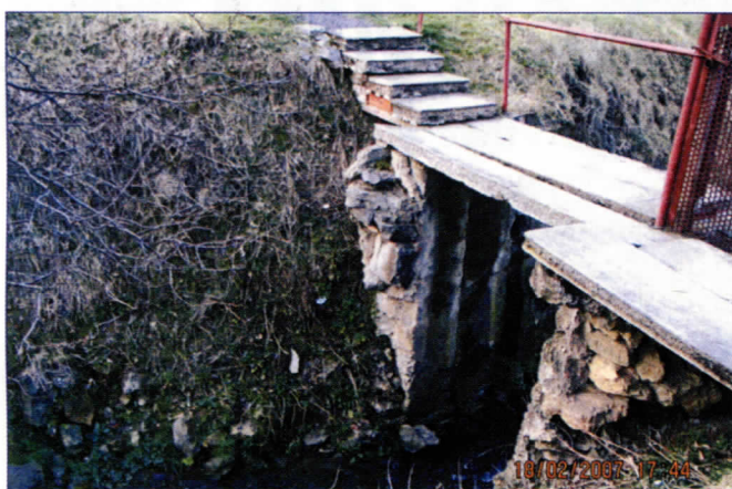
Импровизовани прелаз опасан за пешаке

Безброј вапаја и молби са различитих састанака упућивали су грађани Кијева локалној власти у Раковици да се уради канализација кроз старо Кијево, јер кијевски поток у који се сливају отпадне воде, практично служи као колектор. Нажалост, на све то из садашње владајуће коалиције у локалној власти нису добили никакав одговор. У међувремену, запуштени кијевски поток, после сваке кише узима свој данак, плавећи куће околних житеља. И мост преко овог потока вода је срушила и однела у поплави 1999. године, а уместо њега стављене су неке кровне плоче. Прелаз нема заштитну ограду, па