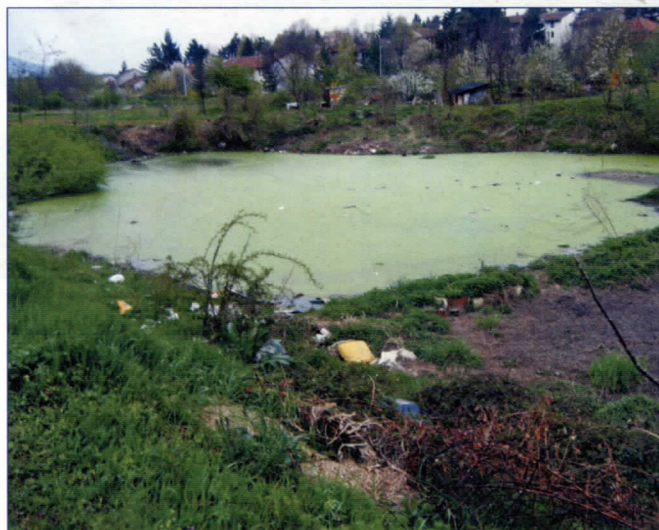
Баруштина и смрад у Мраковачкој

Највећи проблем становника Видиковца је што немају здравствену станицу, па чак ни амбуланту. Они сматрају да би се оне могле отворити у неким од просторија које су власништво општине. На тај начин олакшало би се, нарочито деци, трудницама и старијим особама, који трпећи велике гужве, здравствену заштиту морају да траже у другим деловима Раковице. Видиковчани су незадовољни и понашањем локалне власти у Раковици због начина издавања дозвола за надзиђивање кровних површина. Станари неких зграда кажу да се једноставно изненаде кад угледају скеле предузимача, питајући се како су добили дозволу за надзиђивање и да ли је том приликом испоштована процедура прописана законом.