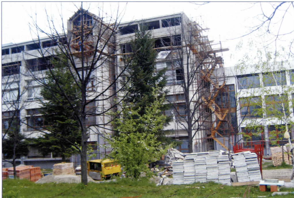
Као да је Скадар на Бојани Надзиђивање почело 2004. и још траје

Грађани М. З. Лабудово брдо у разговору са активистима Српске радикалне странке отворили су душу о незадовољству учинком садашње локалне власти у Раковици. Говорили су о свему што је, по њиховом мишљењу потребно да се, за добробит становника ове месне заједнице уради. Навели су шта очекују од Српске радикалне странке, верујући да ће српски радикали после 11. маја сигурно вршити власт у Раковици. Како