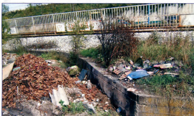
Дивље депоније свуда по Раковици

Само добри познаваоци Кнежевца могу да се снађу у овој месној заједници, јер је негде цео квартал означен под истом адресом. Многе улице у овом насељу немају канализацију. Очигледан пример су Улица 2. септембра и Улиц Славка Родић, које немају ни асфалт, а многе од њих и по неколико стотина метара немају ни стазе за