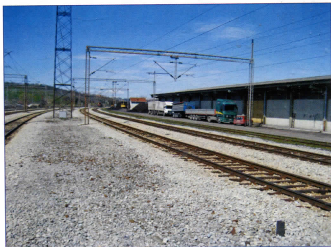
Деца овде прелазе пругу

Ресник је једно од најстаријих насеља на територији Раковице. Добри познаваоци кажу да је њихова основна школа стара преко 130 година. Ресничани истичу да су они и Дорћолци међу првим у Београду имали јавно купатило. Такође су некад имали и сопствени водовод са великим резервоаром и целокупном опремом за рад, а квалитетним млечним производима, нарочито сиром, снабдевали су велики број београдских домаћинстава. Имали су и свој Дом културе којим сада газдују приватници, јер је издат у закуп за друге намене. Од свега тога што су Ресничани имали, сада немају. Чак је и стару основну школу која је могла бити споменик културе општинска власт продала у бесцење са