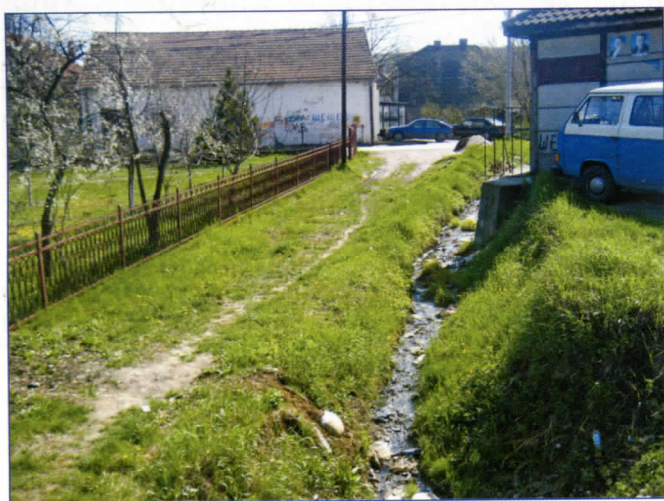
Канализација у улици Александра Војиновића

Многим породицама пре више десетина година учињена је велика неправда одузимањем пољопривредног земљишта, зарад оснивања Земљорадничке задруге, која је одавно пропала, а земљиште није враћено власницима. На њихову несрећу општинска власт у Раковици сада то земљиште третира као државно и крчми га давањем у закуп по такорећи симболичним ценама. Велико бесправно изграђено насеље Љубише Јеленковића са преко 500 домаћинстава, неки су назвали Раковичка Калуђерица. У овом насељу још у току градње а и касније велики проблем је био што нема комуналне инфраструктуре. Општинска власт у Раковици потпуно се оглушила за невоље ових људи,