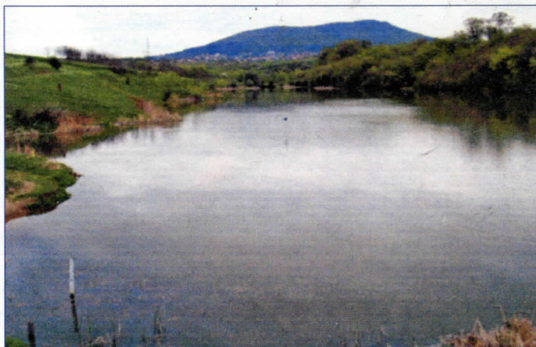
Неиспуњено обећање “демократа” да ће уредити језеро

Вештачко језеро Паригуз у Месној заједници Авала град направљено је 1985.-86. године. Направљено и препуштено самом себи или како се то често у народу чује “зубу времена”. Од најављиваног уређења ресничког језера 2004. године нема ни трага а камоли да се било шта ради у вези тога. Ресничани су навикли на лажна обећања садашње локалне власти, па њихова обећања више и не узимају за озбиљно. Сетимо се најаве да ће ово језеро бити “Мала ада”, са спринт стазама, одбојкашким и спортским теренима, паркинзима, ресторанима и слично. А шта је од тога урађено? Довољно је отићи до језера Паригуз и видети да су обале зарасле у коров и шипраг, по води пливају разне пластичне кесе и боце, а на дну отпад и олупине од аутомобила. Вода у језеру је загађена јер не постоји одговарајућа канализациона мрежа која би примала отпадне воде из септичких јама, као и воду загађену пестицидима оближњих пољопривредних култура. Ипак, уверавамо Ресничане и не само њих да ће Српска радикална