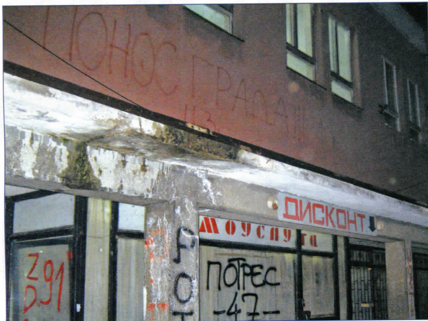
Руинирана зграда Месне заједнице

неколико десетина ари земље. Постојећа основна школа "Коста Абрашевић" не задовољава ни приближно стандарде. У неким учионицама доле је само бетон, а многи тоалети су неисправни. Реснику је потребно и ново обданиште јер се многи родитељи жале да за своју децу не могу добити место у новоизграђеном обданишту у М. З. Авала град.