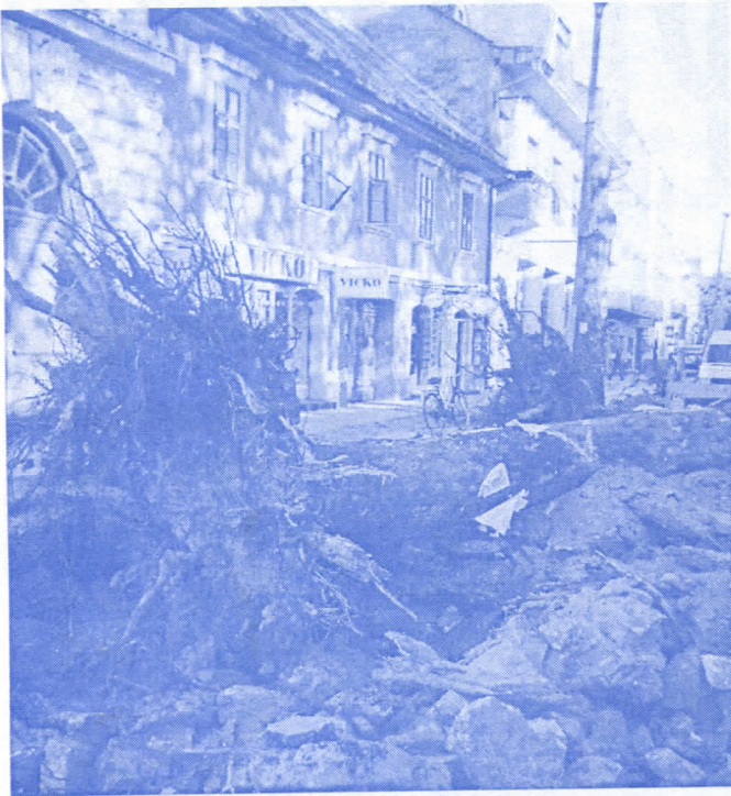
(Сомборски главни сокак) Ово није приказ НАТО бомбардовања из '99. Трагови „демократске власти“ Септембар 2007. године.

препознаје по борди против корупције и лоповлука. Својом борбом против корупције Српски радикали донели су Сомбору четири милиона евра покрајинске инвестиције у реконструкцију главне улице. 4.000.000 евра су покрајински самозвани демократи платили како би извукли локалне самозване демократе из криминалне афере у којој су покушали да