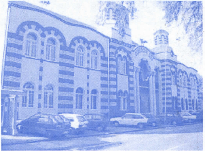
(Соколски дом) Слика 3

кривично дело злоупотребе службеног положаја и кривично дело несавесног вршења дужности. Да је буџетски инспектор упозорио председника општине да, по члану 58. наведеног закона, локалне власти не могу издавати гаранције на „кредит“ за сомборски сокак (а посебно не преко милион евра, нешто преко 10 милиона наших