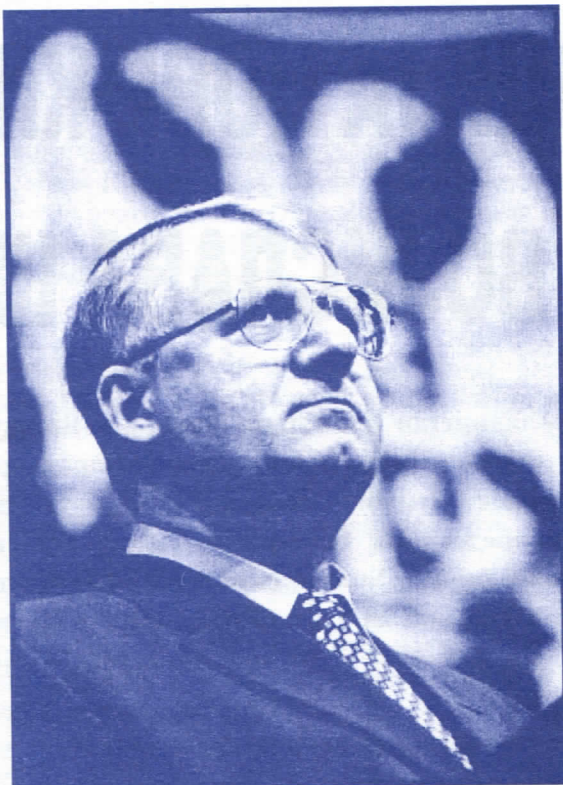
ПРОФ. ДР ВОЈИСЛАВ ШЕШЕЉ