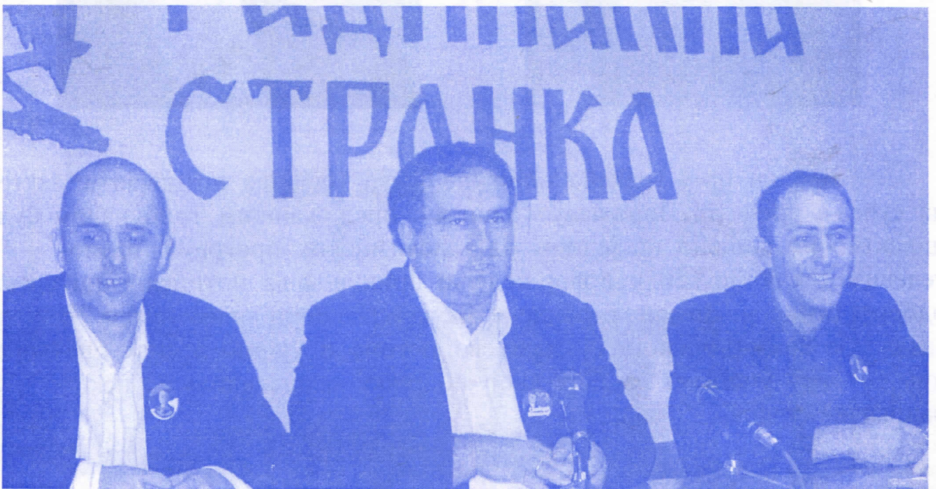
Општински одбор уверен у нову изборну победу

Без обзира како ће у будуће до локалних избора изгледати скупштинска већина у општини Бачка Паланка једно је сигурно да ће српски радикали остати доследни у спровођењу идеја да локална самоуправа буде сервис грађана.