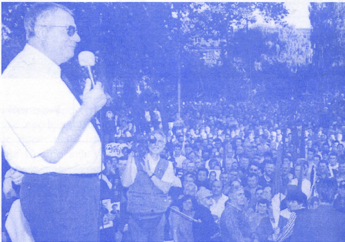
Бачка Паланка уз Војислава Шешеља

Ако желимо да на власти буду одговорни људи а не они који са скупштинске говорнице се хвале да ће они лично обезбедити средства преко партијских веза потребно је да се изађе што масовније на наредне изборе и још једном потврди онима који то још не знају за кога је општина Бачка Паланка