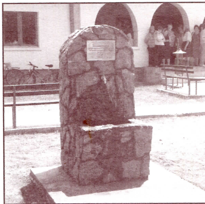
Водовод пуштен, а вода пошлекла из сеоског хидрофора

Једино је урађено то, да је неко анонимно предао пријаву надлежним органима. Међутим, општински органи нису надлежни због висине износа, него су надлежни окружни. Окружни су из разлога што Скупштина није усвојила Извештај анкетног одбора, све ставила ад - акта. И појео вук магарца! А због чега? Због тога што је тадашњи председник Скупштине, који је директно, кршењем пословника, заташкао целу ствар, а исти човек је и сада председник Скупштине, само сада је члан Демократске странке.