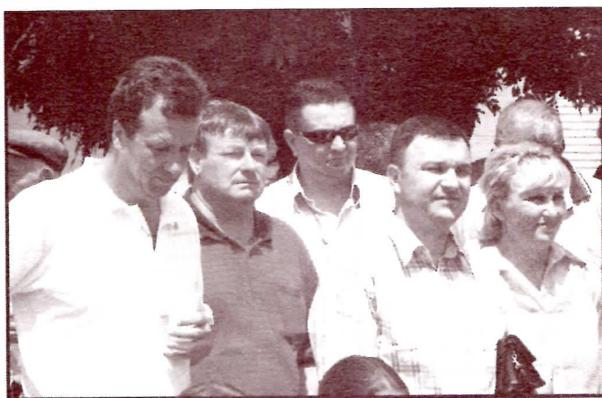
Август 2006. г. - Челници општине на отиварању чесме у Плажану а воде нема ни данас