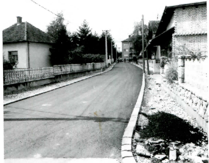
Зар и друге улице не могу да изгледају као ђреседникова (Буџино сокаче)