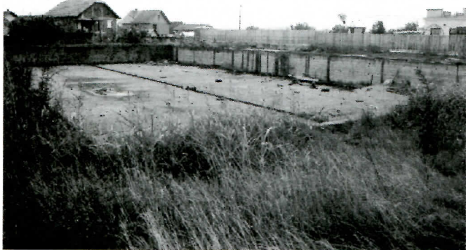
Општинску власи не интересује завршетак Олимпијског базена