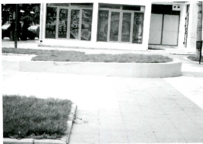
Решена судбина "фонџане"

Дакле, коалиција СПО, ДС, ДСС, ПСС одлично функционише, све док су покривени лични интереси њихових одборника, истакнутих партијских чланова и управних одбора. Руку на срце, нису заборавили и неке своје симпатизере. Кад се све сабере, то је једна не баш тако мала група интересно везаних "ушушканих" и збринутих, али на супротној страни су остали грађани који су у већини, а са њима и политички неитомишљеници овог "демократског блока" који се бори против реваншизма, прозивања и шиканирања - али само на речима. Да су се СПО и ДС лепо договорили око заједничких личних интереса (материјалних), било је јасно већ оног тренутка када из претходног ДОС - овог скупштинског сазива нико није сносио одговорност за "промашај", што случајне, што намерне. Брзо су се заборавиле "прозивке" за водоснабдевање, самодопринос, гасификацију, асфалтирање, ненаменско трошење средстава из буџета... И још што шта. Требало је само мало времена да се открије и право лице ДСС-а и самозваног