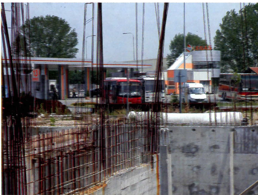
Демократски перформанс аутобуске станице

Жртвује се једна изузетно важна делатност, регулација мирујућег саобраћаја, који је основ за свеукупни привредни, туристички, културни, безбедоносни и регионални развој општине, што су основне поставке ревидираног програма развоја и Акционог плана општине Лесковац.