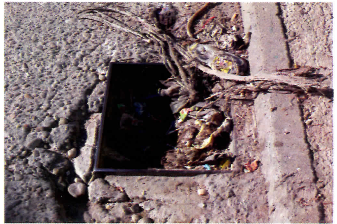
Шахта без поклопца - мини депонија

Градски душебрижници нису учинили ништа да заштите пољопривреднике од накупаца који стварају нелојалну конкуренцију у легалним токовима откупа.