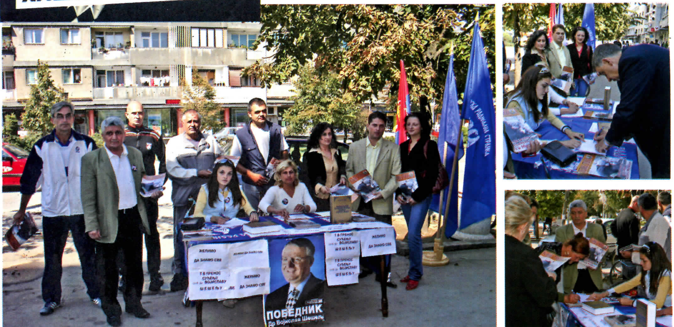
Успешна акција прикупљања потписа СРС - Велики одзив грађана

После пет година проведених у Хашком казнимату тужиоци су се смиловали да коначно почну суђење проф. др Војиславу Шешељу. У Хашком трибуналу нема правде, то је место где се суди Србима и српском народу. Тамо се о истини не суди тамо се истина кроји. Због тога је Српска Радикална Странка покренула акцију да суђење проф. др Војиславу Шешељу, пред Хашким трибуналом, буде директно преношено на једном од телевизијских програма Јавног сервиса Србије чије је начело "Ваше је право да знате све". Акција прикупљања потписа трајаће до 7. новембра 2007 год. када почиње суђење проф. др Војиславу Шешељу.