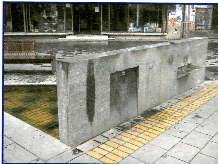
Зар је вода у Зрењанину исправна за пиће?

П oштене демократе, зашто у општинама где сте на власти радите уређење центра града у граниту и то искључиво преко фирме "УНИАГЕНТ" - Футог?