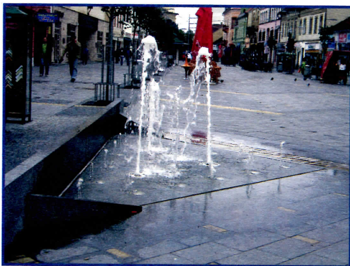
Председниче, пукле цевии у центру