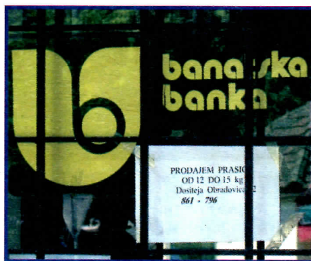
Уобичајена слика на вратима банака наше општине у насељеним местима

За плаћање адвокатских услуга, иако имају своје правнике, утрошено је 1.386.500 динара, на разноврсна спонзорства 480.000 динара а за промоцију директора предузећа листу "НИН" који је објавио интервју са њим уплаћена је сума од 86.000 динара.