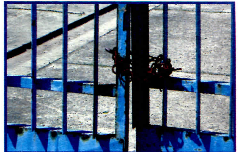
Све чешћа слика испред наших фирми