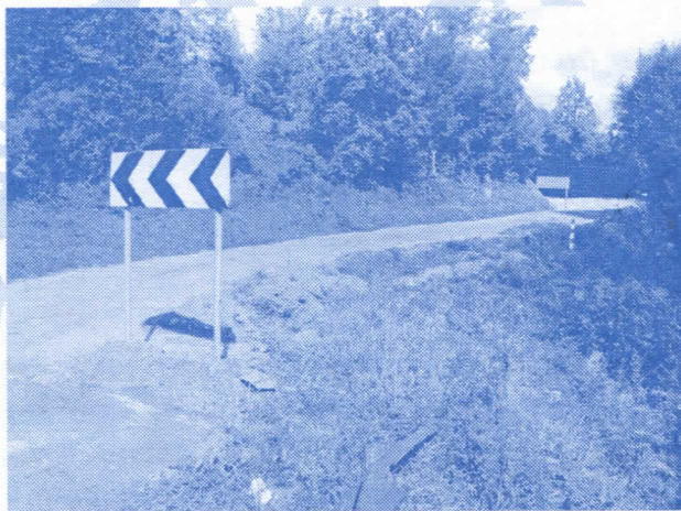
Регионални путни правац Крупањ – Столице - Лозница

Регионални путни правци Крупањ – Лозница, преко Столица и Крупањ – Шабац, преко Завлаке само што нису пресечени клизиштима. Тако стоји годинама. Започети радови на путу Крупањ – Љубовија су у застоју, чекају нове изборе да још једном преваре грађане Рађевине.