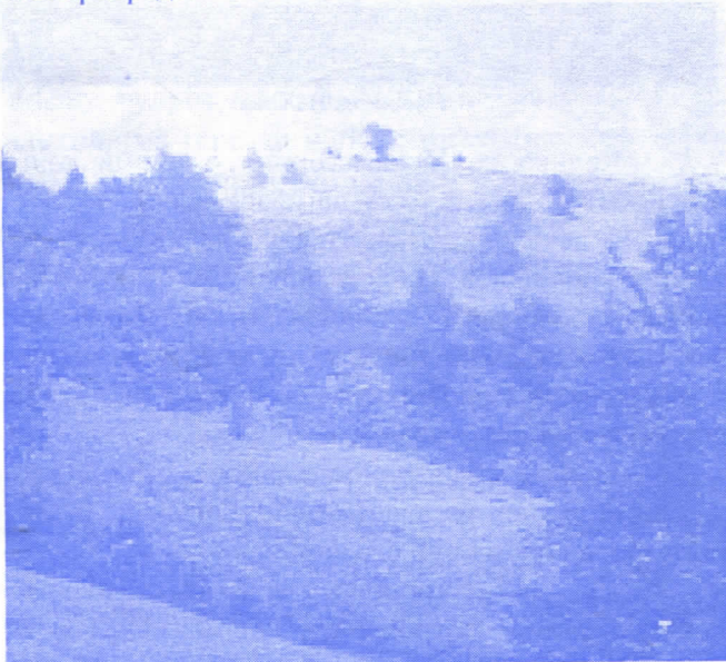
Сеоски предео у околини Ваљева

Ваљевски крај има врло повољне услове за организовање ефективне пољопривредне производње на имањима пољопривредника. Ти услови се огледају у присуству широке лепезе прерадних капацитете са великом могућношћу прихватања вишкова пољопривредних производа од индивидуалних произвођача. Квалитет путне мреже, близина значајних тржишта као што је београдско омогућује значајнија улагања у промену привредне структуре на сеоским домаћинствима и технолошких унапређења, све у циљу освајања нових производа (поврће и воће) за потребе тих тржишта. Ваљевски крај више од сто година учествује у робној размени пољопривредних производа са земљама западне Европе и Русијом, и то је значајно вишегодишње искуство које не сме бити игнорисано будућим извозним стратегијама свих релевантних спољнотрговинских фактора Републике Србије. Наравно мора се истаћи да све предности често не решавају и дугогодишње проблеме аграра наше земље, којима се мора приступити селективно. Најпре све проблеме треба превасходно, истински идентификовати и пронаћи правилне механизме за њихово решавање, а пре свега јасно дефинисати носиоце послова на њиховом решавању и уопште на свеукупном преображају пољопривреде ваљевског краја кроз подстицај раста и развоја сеоских домаћинстава као кључних фактора раста ефективности укупне пољопривреде.