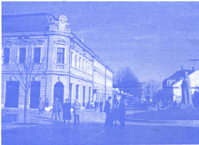
Ваљево - центар града

Добили смо само размишљања где смо у ово тмурно време? Немамо државу, немамо праву власт, имамо проблеме, беду, корупцију... Они су својим подлим улагивањем код светских моћника довели нас и нашу децу на пут без јасног видика.