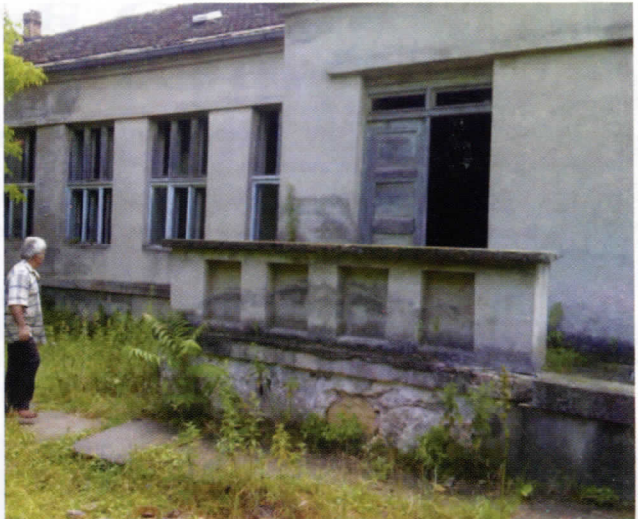
Школа или рушевина у Доњој Дубони