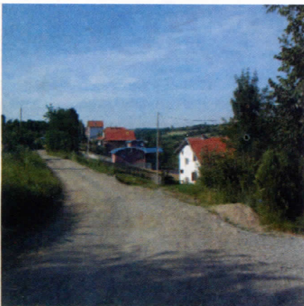
Улица Сестара Марјановић у насељу 25. Мај

Дом културе који је изграђен средствима самодоприноса сматра се највећом тековином јагњилаца - данас је, практично, потпуно изгубио своју првобитну намену.