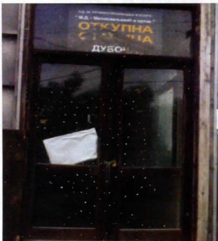
Воћа на претек - катанац на вратима - управник у ДОС-у-