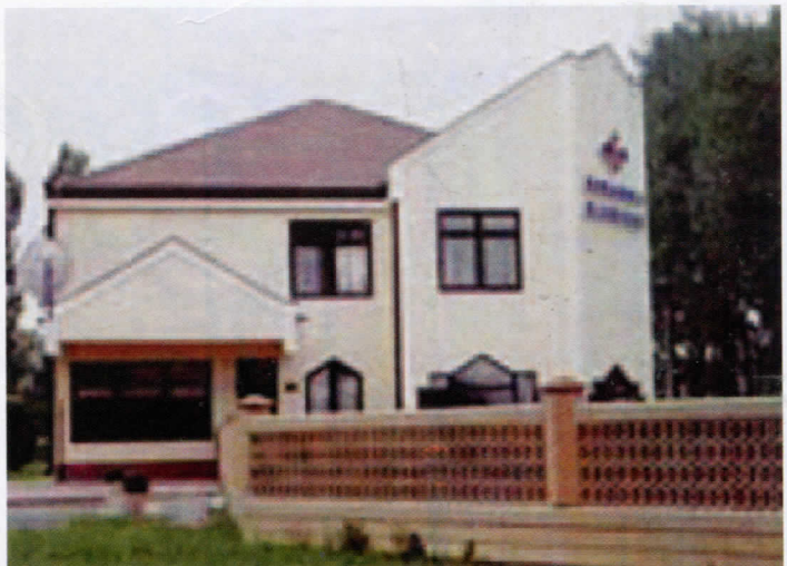
Плочница по плочица, распарча се Керамика

Најава приватизације највећег младеновачког предузећа ХК Петар Драштин, у којој је од некадашњих 2. 000 радника, преостало мање од половине, још увек је у