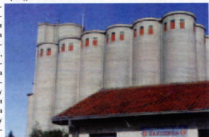
Нема хлеба без мотике, ни Маковице без приватизације

магли. И поред јаке медијске пропаганде, будући власник ( Енглеz индијског порекла ), још увек се не