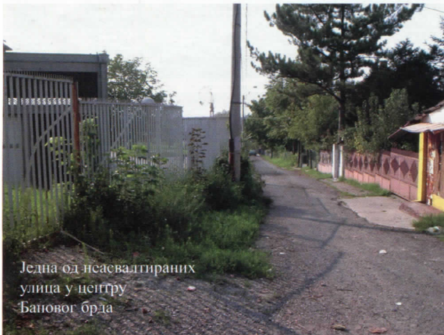
Једна од неасфалтираних улица у центру Бановог брда