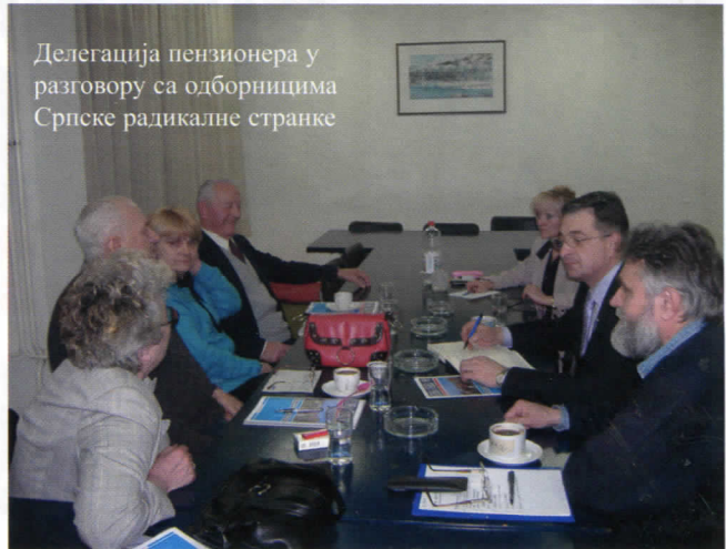
Делегација пензионера у разговору са одборницима Српске радикалне странке

Насељена места у руралном делу општине: Сремчица, Рушањ, Велика Моштаница, Умка, Остружница, Макиш и Железник делови су општине који су потпуно запуштени и заборављени од локалне власти Демократске странке која се у протекла три мандата владавине није показала као власт која брине о решавању наведених локалних проблема, већ власт која се бавила само личним интересима појединаца чланова Демократске странке. Урбани део општине: Баново брдо, Михајловац, Церак, Виногради, Жарково, Беле воде такође је заборављен од стране демократа у решавању питања локалних проблема. Готово да од 110