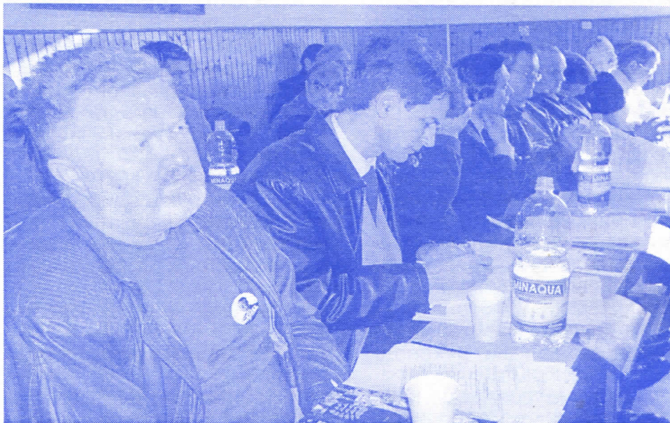
Одборничка група Српске радикалне странке

Међутим, скупштинска већина (СПС, ДС, ДСС) је, и овога пута, показала своју неспремност на било какав компромис са представницима Српске радикалне странке, без обзира на квалитет њихових предлога и интересе грађана Бајине Баште. По ко зна који пут владајућа коалиција је демонстрирала своје јединство у одбијању свих предлога који долазе од српских радикала..