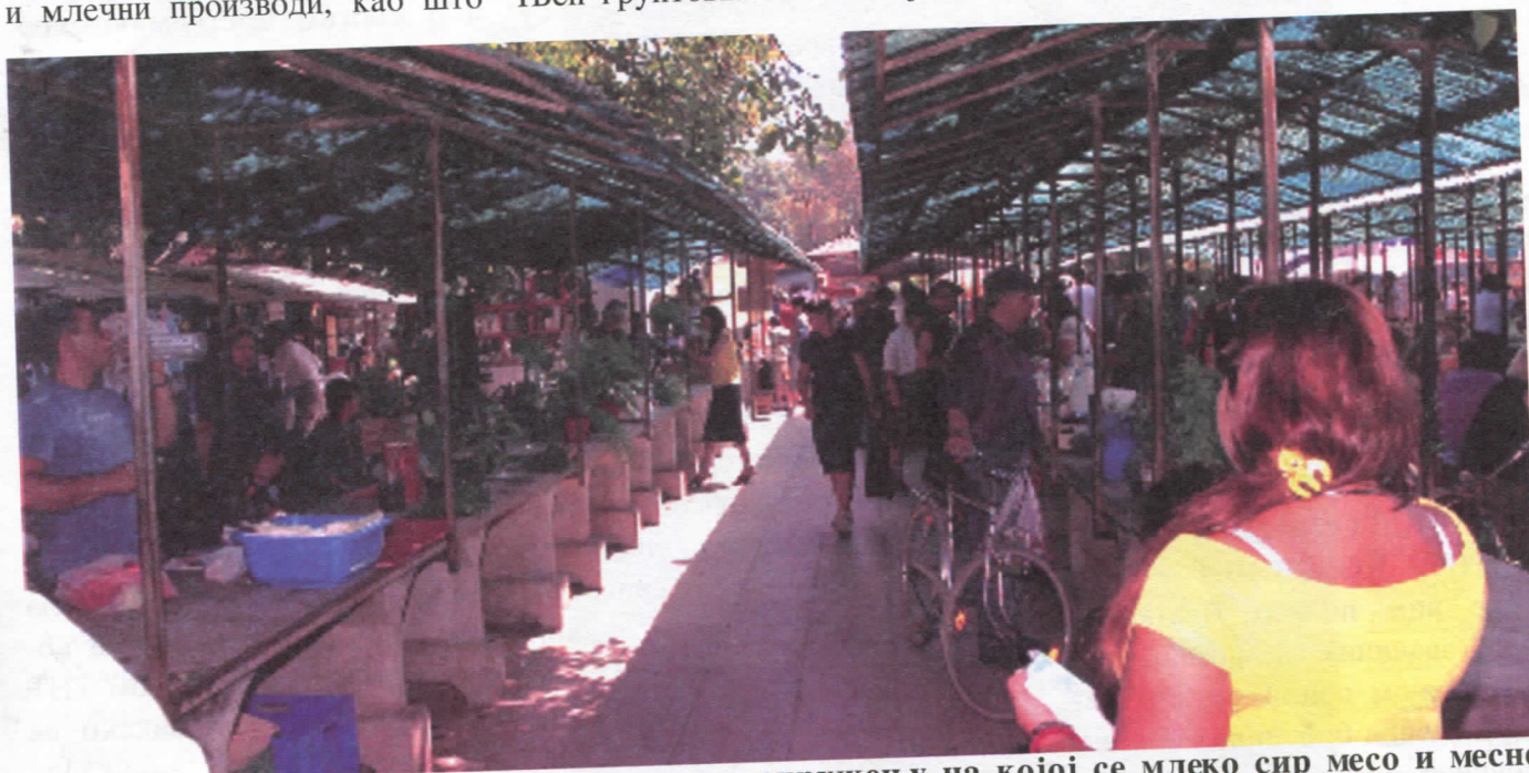
Белоцркванска пијаца: једна од задњих у окружењу на којој се млеко сир месо и месне прерађевине продају под ведрим небом и без потребне контроле.

Бела Црква којој су ускраћена права на приходе којима би сигурно преуредила постојећу пијацу. За све ово сазнао се захваљујући ОО СРС који је отворио ово питање и који ће покушати да исто разреши у наредном периоду, ЈЕР ОВАКО СЕ ВИШЕ НЕ МОЖЕ. Несмемо чекати да нам се деси зло па да онда реагујемо. Проблем се мора приоритетно решити, јер су у питању наши животи.