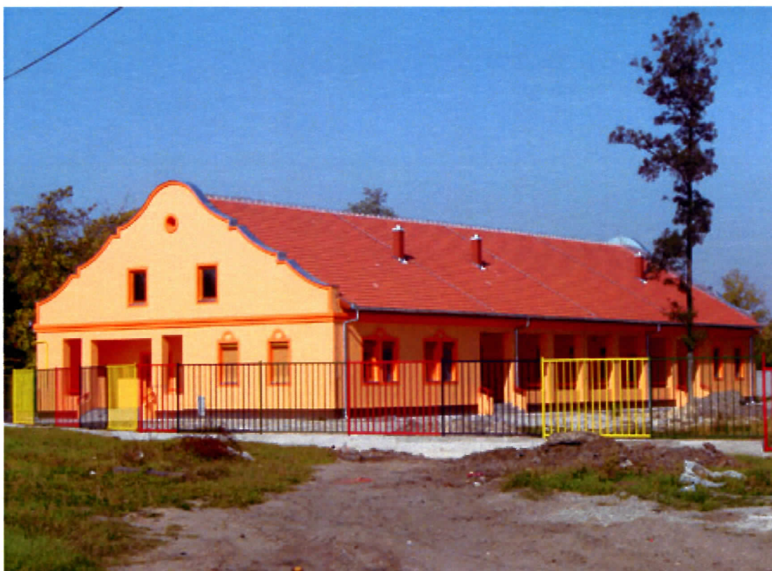
НОВОИЗГРАЂЕНО ОБДАНИШТЕ НА ЧЕНЕЈУ

ПОРЕД ГРАДСКОГ ЈЕЗГРА ОБЈЕКТИ СЕ РАДЕ И У ПРИГРАДСИМ НАСЕЉИМА