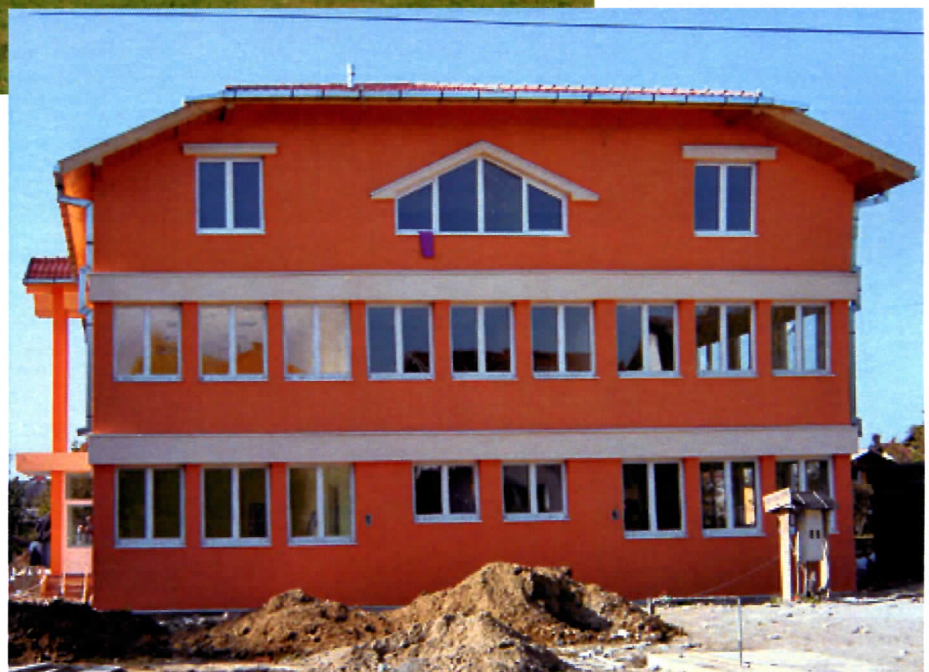
ОБЈЕКАТ У ИЗГРАДЊИ ПРЕДШКОЛСКЕ УСТАНОВЕ У СРЕМСКОЈ КАМЕНИЦИ