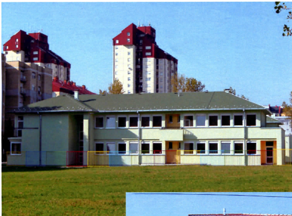
НОВО ИЗГРАЂЕНИ ОБЈЕКАТ ПРЕДШКОЛСКЕ УСТАНОВЕ НА ЛИМАНУ