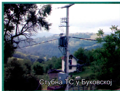
Стубна ТС у Буковској

У циљу побољшања напона електричне енергије на веома разгранатој мрежи постављено је неколико стубних трафо станица и то у насељима Церовица, Буковска, Нересница, Вољуја.