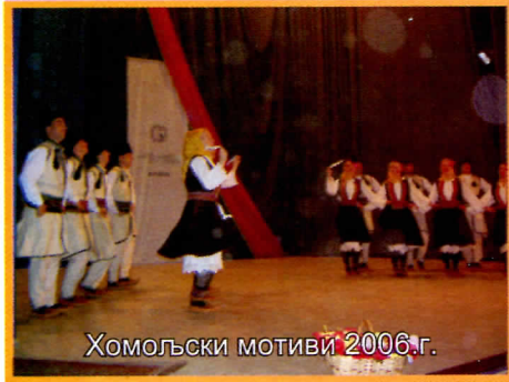
Хомољски мотиви 2006.г.