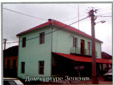
Дом културе Зеленик