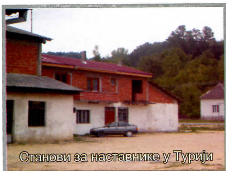
Станови за наставнике у Турији

У акцији реконструкције, а у циљу спречавања од даљег пропадања извршена је реконструкција Домова културе у Мустапићу и Зеленику.