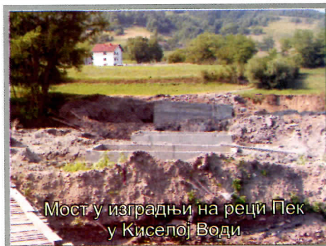
Мост у изградњи на реци Пек у Киселој Води

У насељу Мустапић извршена је потпуна реконструкција основне школе (крова, учионица, мокрог чвора, ђачке кухиње и трпезарије) замена столарије - прозора.