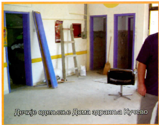
Дечије одељење Дома здравља Кучево

У току су консултације о могућности преношења оснивачких права Домова здравља са Министарства на општину у циљу материјалног побољшања ове установе.