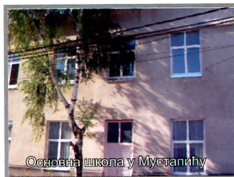
Основна школа у Мустапићу

У насељу Мустапић извршена је потпуна реконструкција основне школе (крова, учионица, мокрог чвора, ђачке кухиње и трпезарије) замена столарије - прозора.