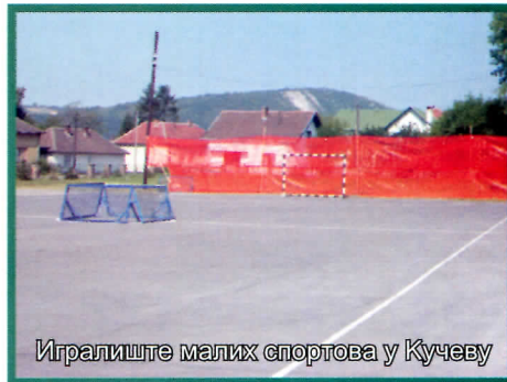
Игралиште малих спортова у Кучеву

Кучево је по први пут добило веома уређену градску плажу са игралиштем за спортове на песку, пешчану плажу. У дворишту Економске школе у Кучеву реновиране су трибине на игралишту малих спортова, у насељу Мишљеновац израђене су трибине игралишта малих спортова и у насељу Буковска изграђено је игралиште за баскет.