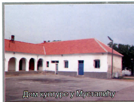
Дом културе у Мустапићу

У акцији реконструкције, а у циљу спречавања од даљег пропадања извршена је реконструкција Домова културе у Мустапићу и Зеленику.