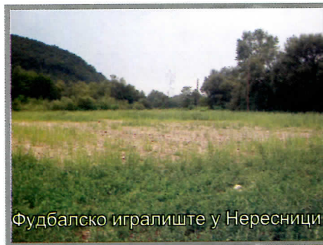
Фудбалско игралиште у Нересници

Друга фаза изградње зграде Општинске управе (изградња и опремање просторија на спрату).