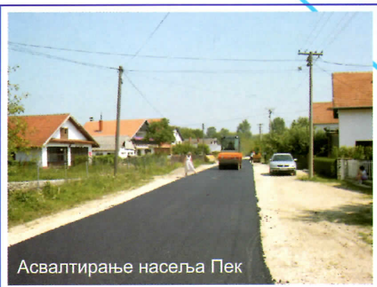
Асвалтирање насеља Пек