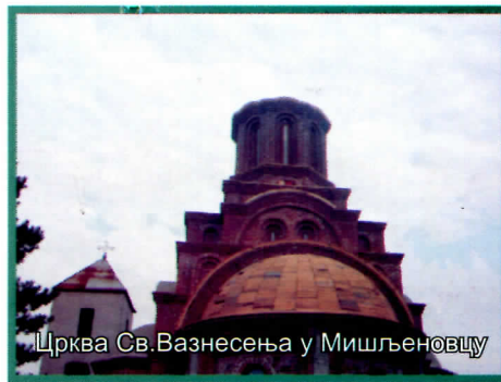
Црква Св.Вазнесења у Мишљеновцу

Локална самоуправа је издвојила значајна средства за изградњу савремене градске капеле у Кучеву, чија је изградња у завршној фази.