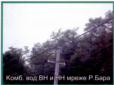
Комб. вод ВН и НН мреже Р. Бара

У припреми је реконструкција градске трафо станице "Бања" која ће у знатној мери побољшати снабдевање електричном енергијом овог дела града.