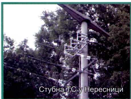
Стубна ТС у Нересници

Кучево је по први пут добило веома уређену градску плажу са игралиштем за спортове на песку, пешчану плажу. У дворишту Економске школе у Кучеву реновиране су трибине на игралишту малих спортова, у насељу Мишљеновац израђене су трибине игралишта малих спортова и у насељу Буковска изграђено је игралиште за баскет.