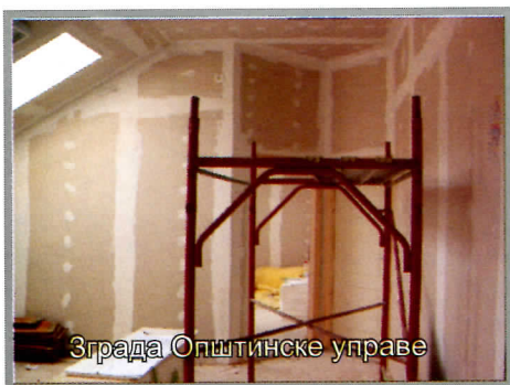
Зграда Општинске управе

Започета је изградња армирано - бетонског моста на реци Пек који ће повезивати насеља Кисела Вода, Буковска и Буковска Река са седиштем општине и осталим насељима.