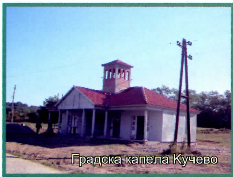
Градска капела Кучево