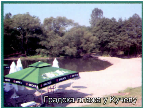
Градска плажа у Кучеву

Такође су уложена и знатна средства у изградњу цркве Св.Вазнесења Господњег у Мишљеновцу, црква Свете Петке у Вољуји и црква Свете Тројице у Шевици.