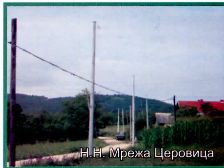
Н.Н. Мрежа Церовица

У насељима Церовица, Нересница и Вољуја у току је реконструкција високонапонских и нисконапонских електричних мрежа дужине неколико километара.