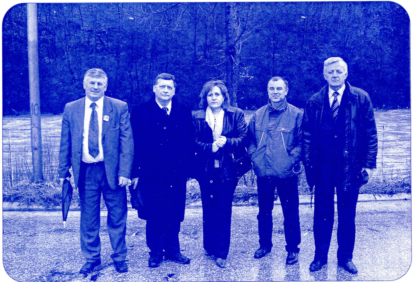
Делегација из Руме у „ФАП“-у при преузимању возила

Надамо се да је ово само почетак акције за добробит Прибоја и његових грађана, а ако нам грађани укажу поверење на републичким изборима те будемо вршили власт, тада ће судбина „ФАП“-а бити извесна јер је познато да Радикали не узимају провизије. Што значи сва јавна предузећа и установе, војска, железница и све оно што је у државном власништву мора ће да узима домаћа возила.