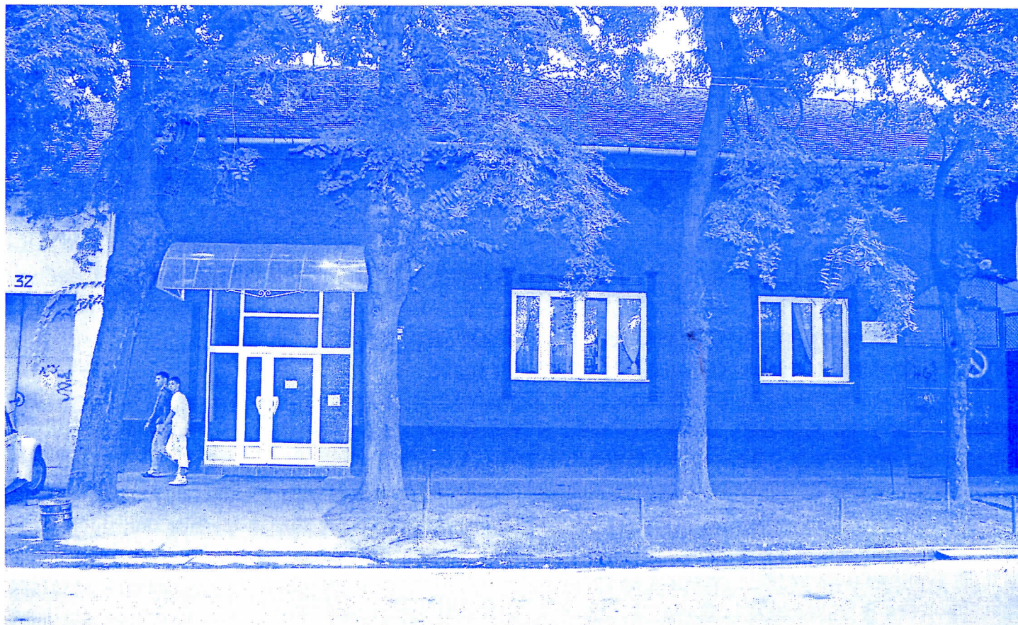
Народна библиотека “Бранко Радичевић”