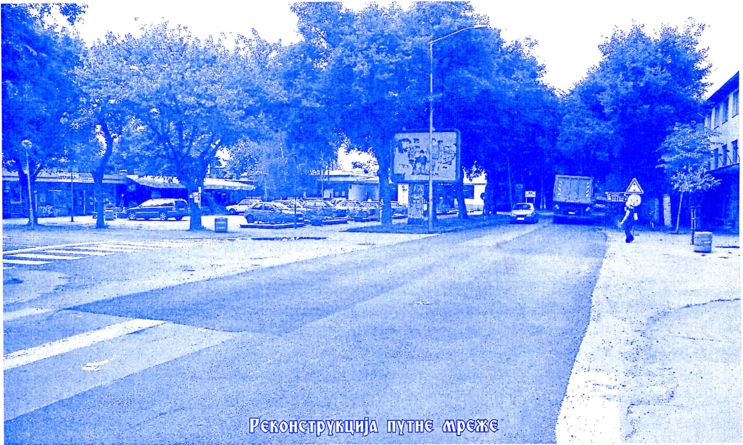
Реконструкција путне мреже