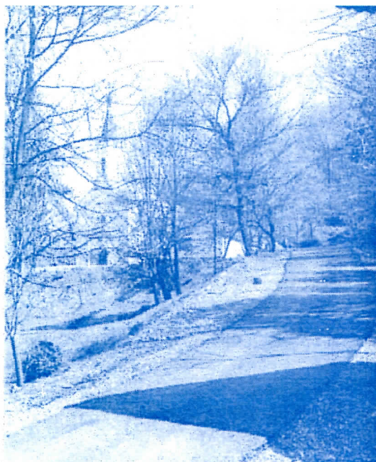
Пут ка цркви у Белановици