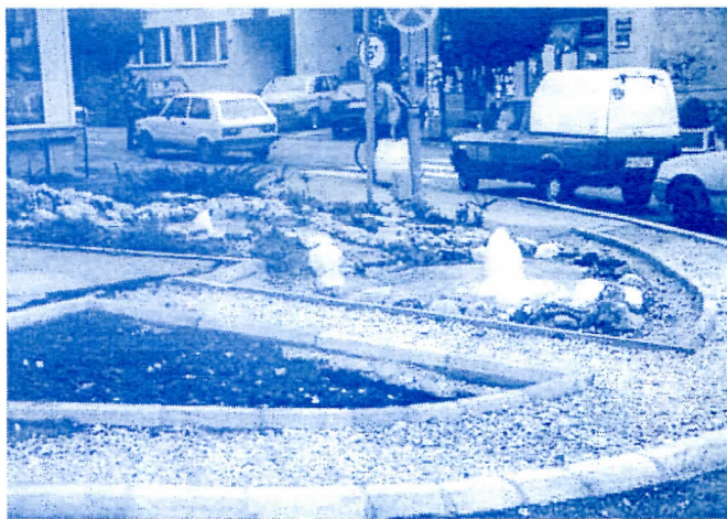
Фонтана у центру Љига

Посебну драж те вечери представљале су драмске уметнице Лидија Вукићевић и Јелица Сретеновић са сценским приказом "Гарави сокак", које су казивањем поезије уз песму и игру дочарале живот Рома и подсетиле колико је важно свагда и свугде