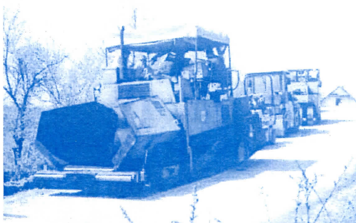
Финишер и друга механизација на почетку асфалтног пута Белановица - Даросава преко Вагана