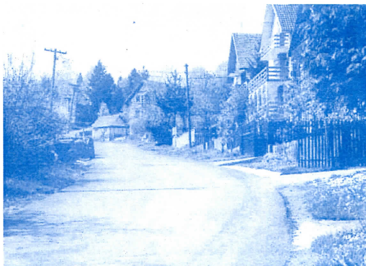
Пут од Белановице ка Калањевцима