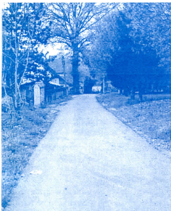
Асфалтирана улица код основне школе у Љигу (Јована Дучића)

Уз помоћ Владе Републике Србије и Министарства за капиталне инвестиције значајан део путева је саниран и доведен у далеко боље стање од периода пре поплава.