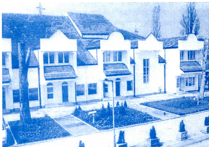
У згради Дома културе урађено је 6 локала, који ће бити издати у закуп

Градски трг у Љигу ове године, током одржавања "Љишких културних вечери" у периоду од 10-14. јула био је слободна лука културе и место међународног састајања. Грађани Љига имали су прилику да у свом граду кроз ревију традиционалних костима Мексика сагледају сву лепоту мексичког фолклора, легенде једног народа, његову поезију и молитве. Раскош мексичког духа, живот праћен песмом, поглед чисте љубави и пријатељства наша два народа носила су као амајлију. Гости из мексичке амбасаде и групе Амаркорд из Београда која нам је кроз мексичку песму и музику дочаравала лепоту Мексика су још једном показали да уметност и култура спајају народе и бришу све баријере.