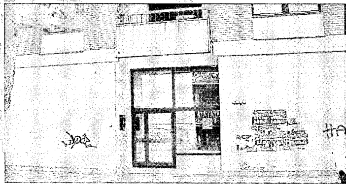
"Бункер", место договора свих "прљавих" послова, и омиљено свратиште Пиштоља

прекрајању изборне воље грађана Старе Пазове исказане на изборима одржаним у септембру 2004 године. У истој пријави је тачно наведено место где се налазио тадашњи начелник