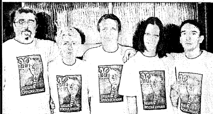
Чланови редакције листа "Велика Србија", морају на оптужничку клупу због писања истине у чланку "Стоп грађевинској мафији" у Ст.Пазови