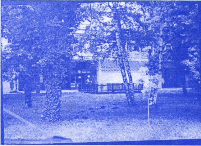
кафана ДС у КПЦ Бач (летња башта-на шта)