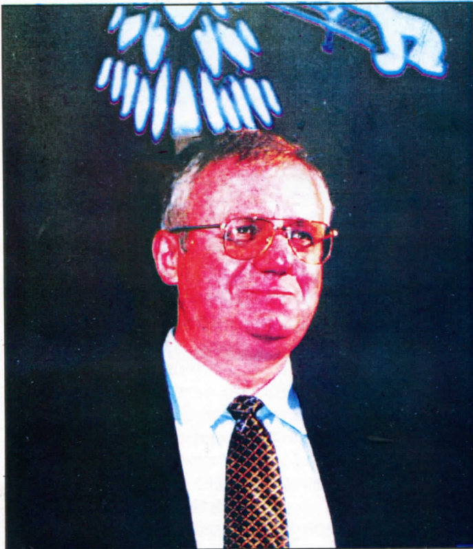
Др Војислав Шешел, борац за интересе српског народа

ТЕСЛИЋ, МАЈ 2006. ГОДИНЕ ГОДИНА XVII, БРОЈ 2537