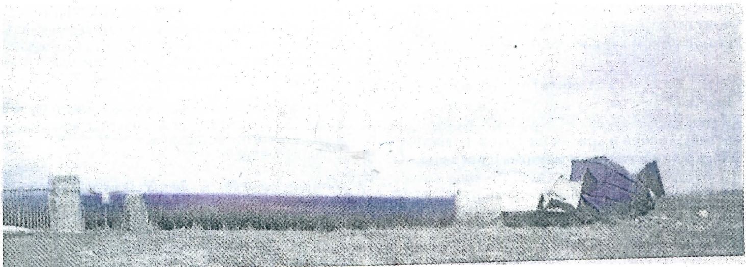
Остаци срушеног водоторња у Марадику након само месец дана