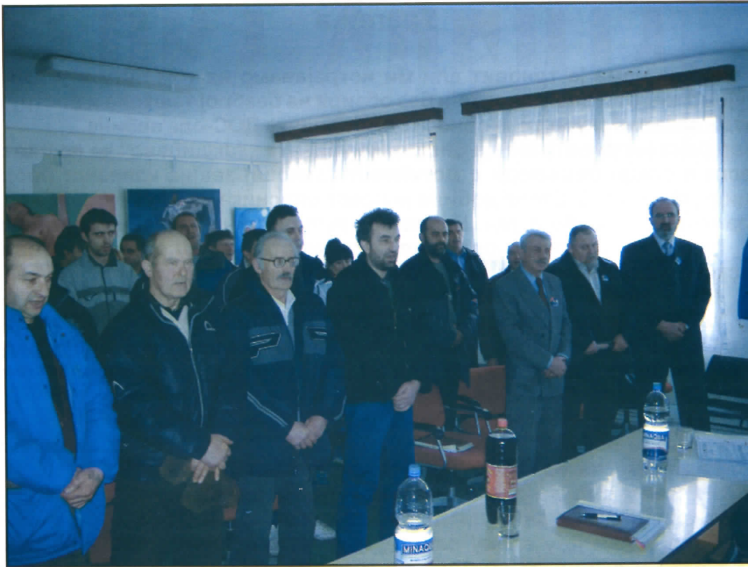
Ойштинска скупштина Српске радикалне странке у Српској Црњи