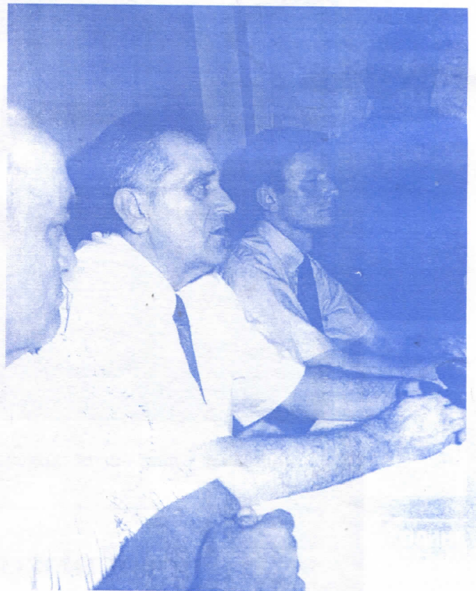
Заменик председника СРС томислав Николић са сарадницима приликом једне од посета Колубарском округу

Због тога Српска радикална странка једини начин за одвицавање од уврежених корупцијских навика види у значајно општријим законским прописима, какви би, на пример, могли бити преузети из Путиновог модела. У том моделу, за разлику од нашег, откривени корупционаши се не шепуре на слободи и не регрутују нове клијенте, док траје доказни поступак. Тамо је поприлично обрнуто: прво их "ставе на сигурно место", па