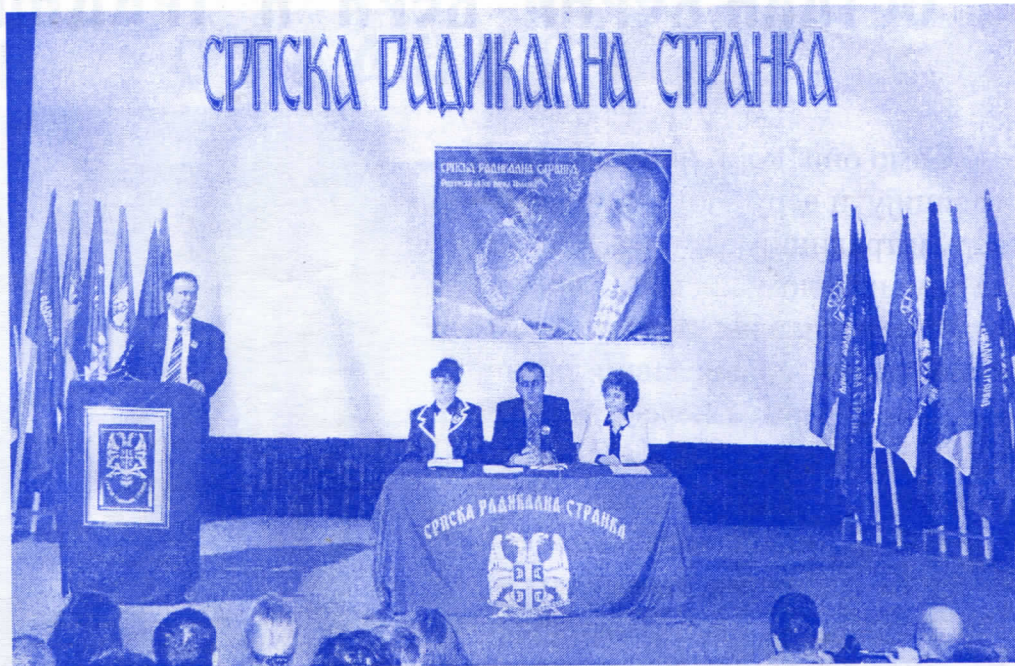
обраћање председника О.О. на годишњој Скупштини

У недељу 26. марта Општински одбор СРС Бачка Паланка одржао је редовну годишњу Скупштину. Сала биоскопа „Војводина„ је била премала да прими велики број чланова и симпатизера.