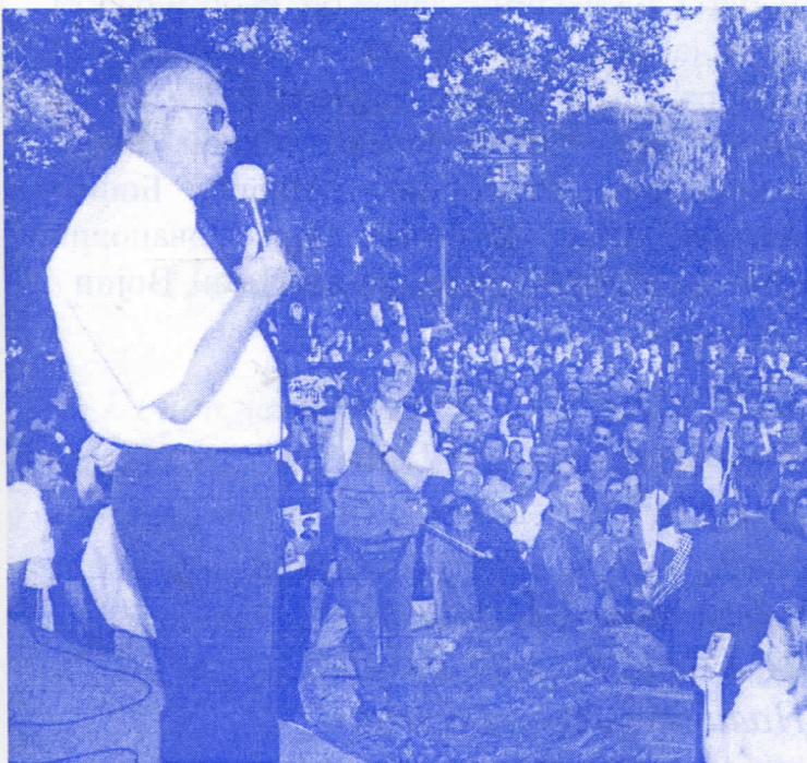
др Војислав Шешељ у Бачкој Паланци

24. фебруара 2006. године навршиле су се три године од када наш председник др. Војислав Шешељ тамнује у Хагу по вољи светских моћника. На великом митингу подршке, одржаном на Тргу Републике у Београду, чланови Српске радикалне странке, симпатизери и родољуби оштро су протествовали против поступка Хашког трибунала према др Војиславу Шешељу и другим оптуженицима.