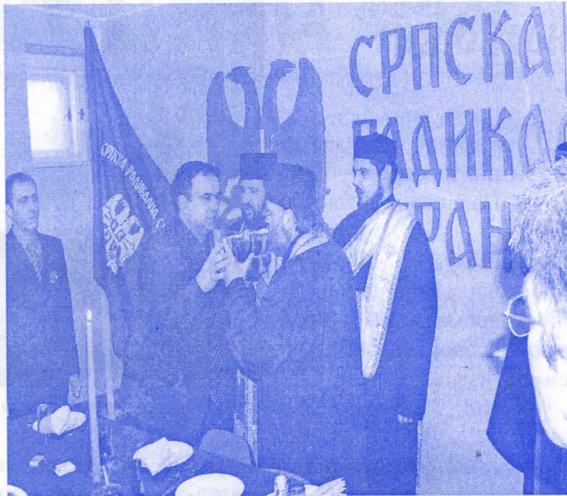
Радикалска слава Св. Три Јерарха

Само они који поштују своју традицију и веру могу поштовати веру и традицију других. У складу са тим начелом крсну славу Српске радикалне странке хришћански православни празник Св. Три Јерарха 12. фебруар српски радикали су уз свећу и колач, присуство свештених лица и многобројних чланова странке у Месним одборима: Челарево, Младеново, Обровац, Товаришево, Гајдобра, Силбаш, Деспотово, по први пут у Парагама, а четири градска одбора заједно обележили славу.