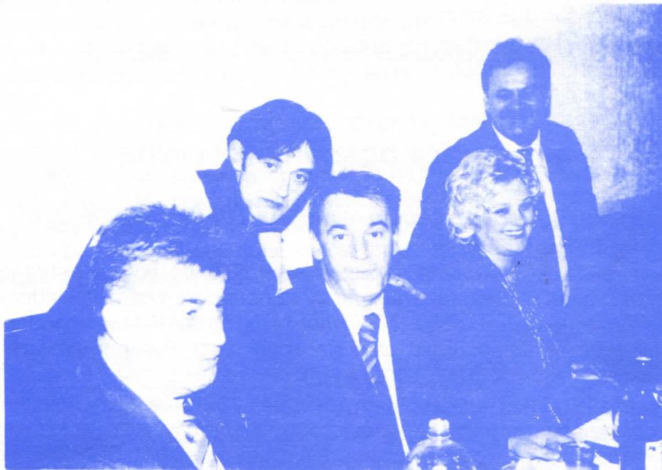
Прослава крсне славе Три Јерарха у ОО Србобран; Гости: Милорад Мирчић и Јоргованка Табаковић

Српска Радикална Странка, као и сваки добар домаћин има своју крсну славу, Света Три Јерарха, своје свеце заштитнике. Обележена је и прослављена 12. фебруара у сва три месна одбора, Србобран, Турија и Надаљ. Прослава крсне славе била је у свим местима изузетно посећена. Бројни гости су уз музику и весеље дочекали и ране јутарње сате.