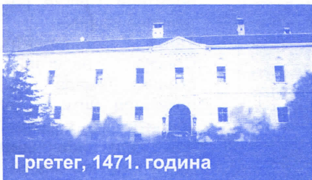
Гргетег, 1471. година

Фрушка Гора се са правом назива Света Фрушка Гора, јер у свом наручју чува највеће благо српског народа! 17 православних манастира налази се на Фрушкој Гори који својом лепотом и културом маме многе вернике и случајне пролазнике.