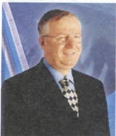
Mr. dr. Vojislav Seselj UN Detention Pompstationsweg 32 NL-Scheveningen (The Hague) Unt Post 87810 NL-2508 The Hague, Holland

Испраћају посмртних остатака Слободана Милошевића, бившег Председника Србије и СРЈ у Београду, 18. марта ове године, присуствовали су и чланови Општинског одбора СРС из Барајева. И овом приликом са пажњом је саслушана порука Проф. др Војислава Шешеља и са бурним оправдавањем подржан наступ Александра Вучића, генералног секретара Српске Радикалне Странке.